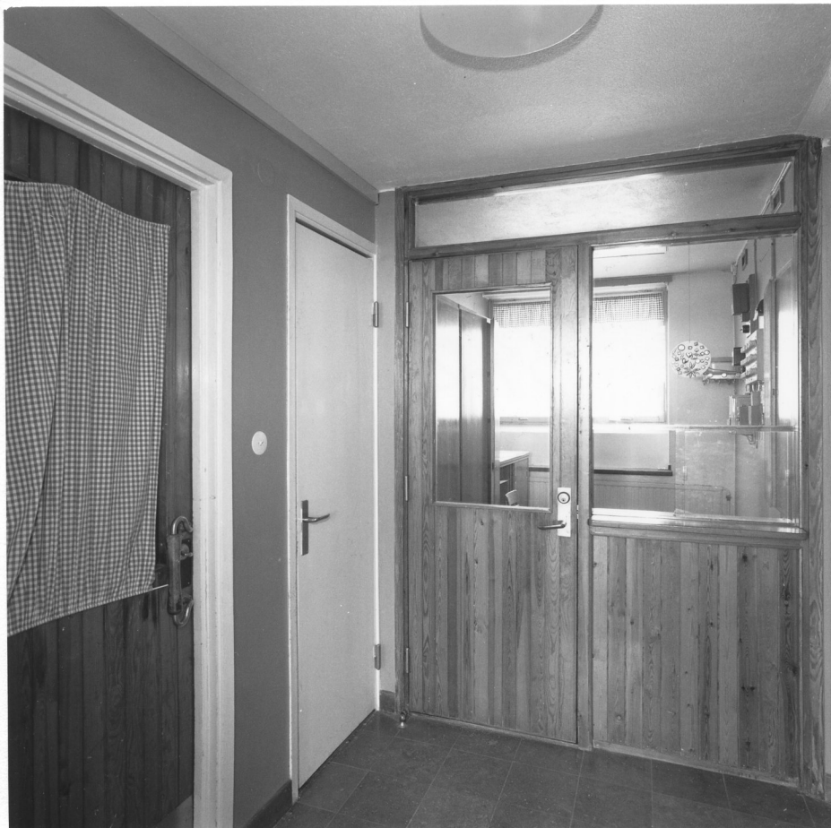
S92-0297-9 Entré till badet.