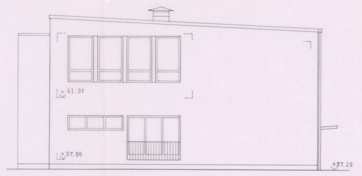
FASAD MOT SYDVÄST E

ÖVERSTÄLLINGSÄMBETET och LÄNSTYRELSEN I STOCKHOLMS LÄN CIVILFÖRHÄRSSEKTIONEN Tekn. dröjden 1961-06-28 den 2/10/61