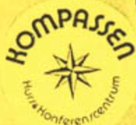
Illustration: Berenike Månbe

Program för BARNKULTUR HÖSTEN 1996 Soc distr 7 Skarpnäck