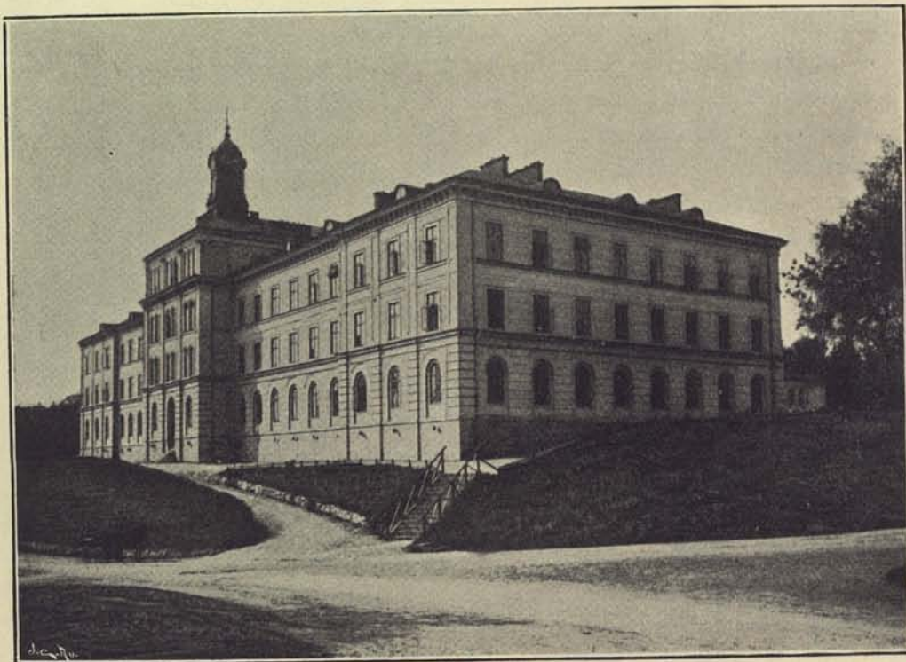
154. Manilla döfstumskola.

I anstaltens verksamhet, sådan den bestämts genom kungl. reglemente den 16 juni 1846, skedde ingen väsentlig förändring förrän år 1874, då i förening med densamma upprättades ett seminarium för bildande af lärare och lärarinnor för döfstumskolan. En ännu viktigare förändring inträdde från och med ingången af år 1879, då blindundervisningen skildes från institutet och förlades till en särskild anstalt; läroverket å Manilla erhöll då benämningen »Allmänna institutet för döfstumma».