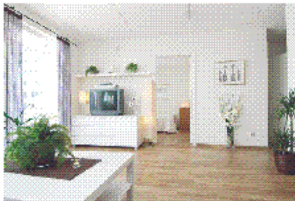
Kungsholmen Rålambshusetleden 44, Plan 5 2:a

Ingång till Kungsholmen och till Kungälv. Vacker och ljus lägenhet med stora fönster och utsikt över Kungsholmen och Kungälv. Lägenheten är utrustad med alla nödvändiga inredningar och möbler. Bra kommunikationer till Kungälv och Kungsholmen.