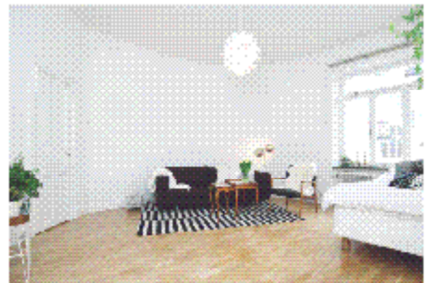
Kungsholmen Kronobergsgränd 19, 4 tr 1:a

Pris: 1 200 000 kr. Lagtillsatt: 1 200 000 kr. Skatt: 1 200 000 kr. Upplysningsdag: 18/4 kl 17:00. Besöksdag: 17/4 kl 17:00. Besöksdag: 18/4 kl 17:00.