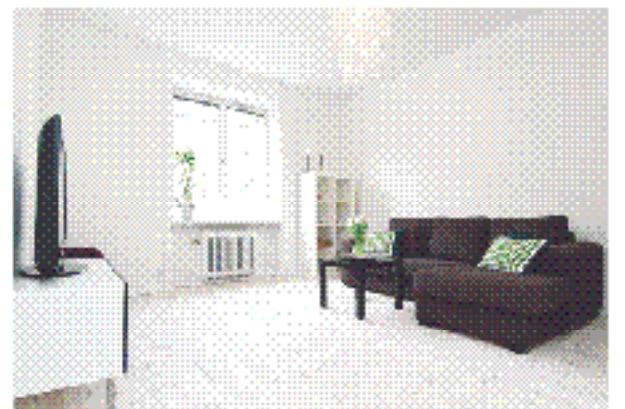
Lånstan Rida Bergen Falugatan 15, 2 tr 1,5:a

Pris: 1 200 000 kr. Lagtillsatt: 1 200 000 kr. Skatt: 1 200 000 kr. Upplysningsdag: 18/4 kl 17:00. Besöksdag: 17/4 kl 17:00. Besöksdag: 18/4 kl 17:00.