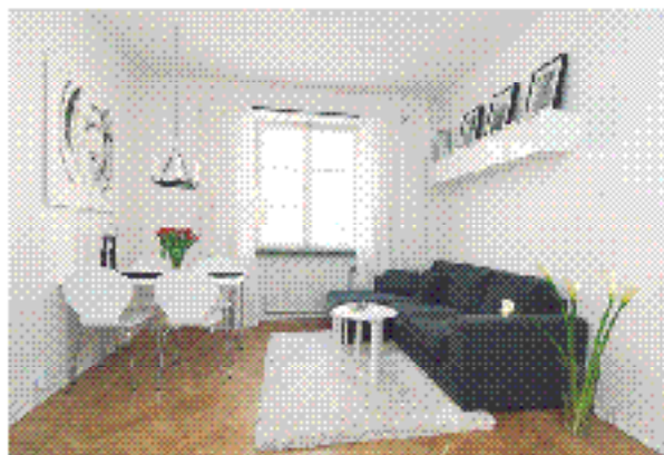
Lånstan Tulegatan 22, 2 tr 1:a

Pris: 1 200 000 kr. Lagtillsatt: 1 200 000 kr. Skatt: 1 200 000 kr. Upplysningsdag: 18/4 kl 17:00. Besöksdag: 17/4 kl 17:00. Besöksdag: 18/4 kl 17:00.