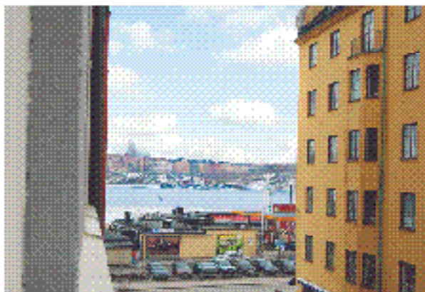
Norra Kungsholmen Garvar Lundins Gränd 4, 2 tr 1:a

Pris: 1 200 000 kr. Lagtillsatt: 1 200 000 kr. Skatt: 1 200 000 kr. Upplysningsdag: 18/4 kl 17:00. Besöksdag: 17/4 kl 17:00. Besöksdag: 18/4 kl 17:00.