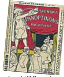
Omslaget till Svenska Panoptikons vägvisare.