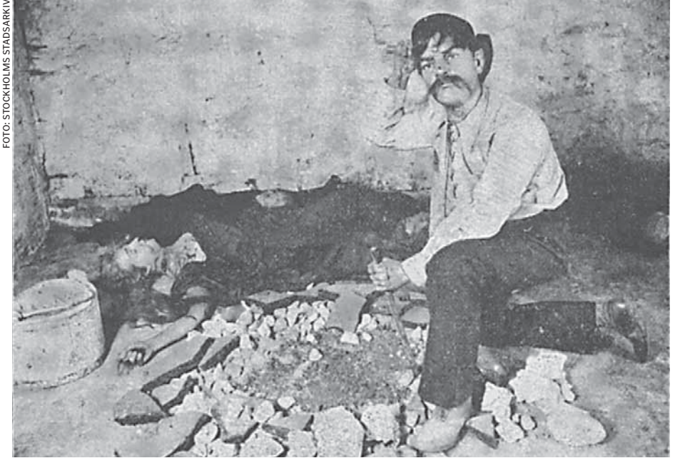
Kvinnomördaren Deeming med sitt offer.