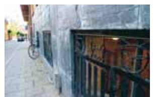
Kattgaller på Bastugatan 25.