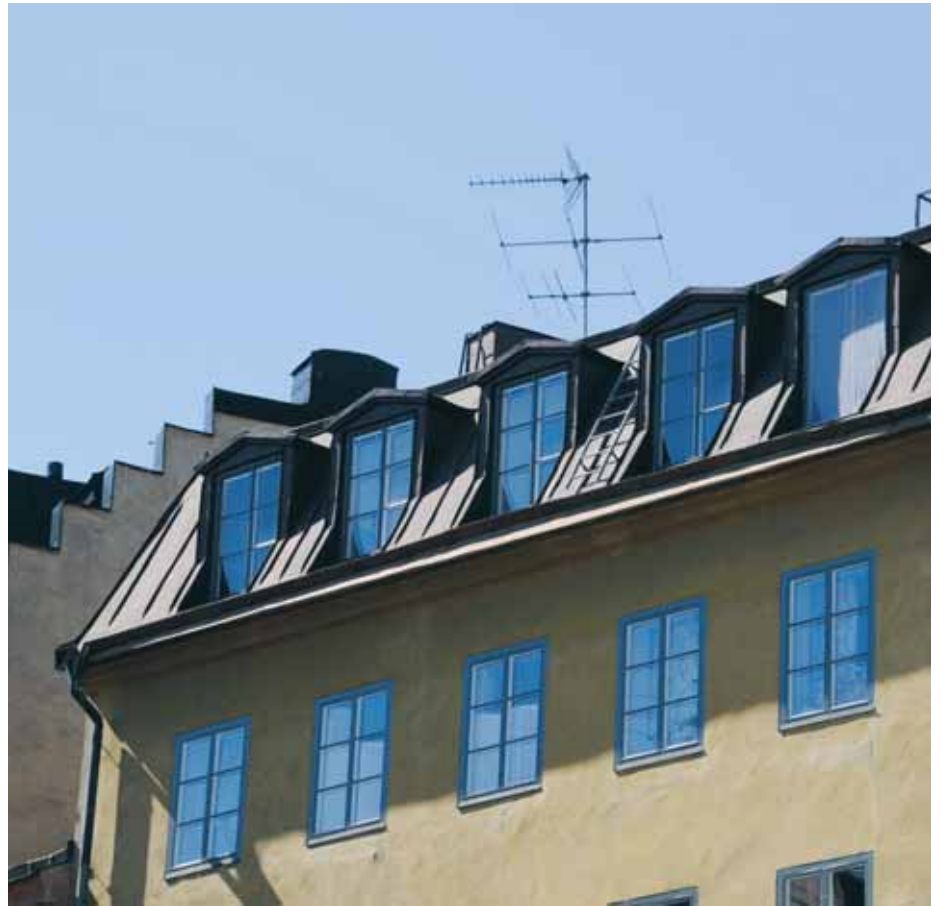
Här på taket (fotograferat från Köpmanbrinken) grips den misstänkte mördaren i augusti 1819. Han avrättades senare på galgbacken i Hammarbyhöjden.

Läs mer om det gamla Stockholm på Stockholmskällan - www.stockholmskallan.se