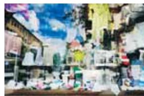
Trikåaffären på Scheelegatan.