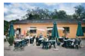
Kaféet i Observatorielunden.