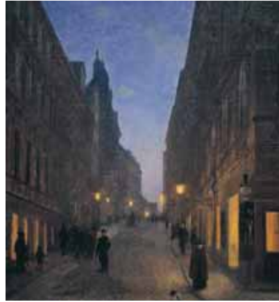
Kvällsstämning på Hamngatan. En oljemålning från 1904 av Herman Lindqvist.