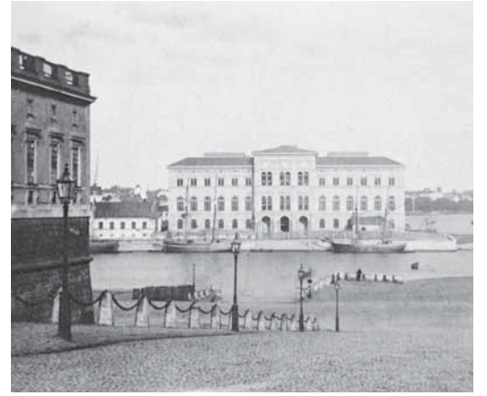
Lyktrad längs med Slottsbacken på 1860-talet.