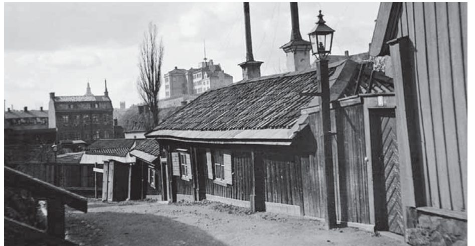
Här på Lotsgatan på Södermalm sitter en lykta på en enkel trästolpe.

LÄS MER OM DET GAMLA STOCKHOLM PÅ STOCKHOLMSKÄLLAN - WWW.STOCKHOLMSKALLAN.SE