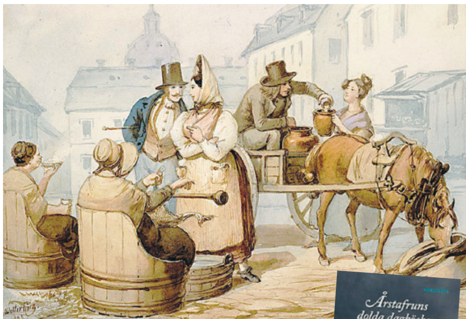
EN SCEN FRÅN HÖTORGET I STOCKHOLM. Akvarell av A.C. Wetterling, 1833. Abraham Johan levde en stor del av sitt liv som vagnmakargesäll i trakten kring Hötorget.