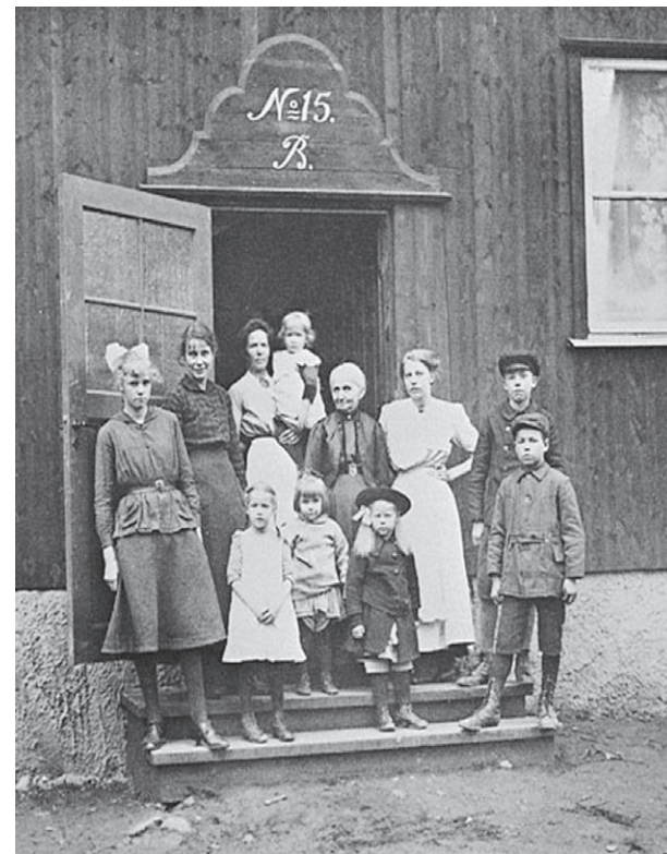
NÖDBOSTAD. Stadshagen år 1917 då området var nybyggt.