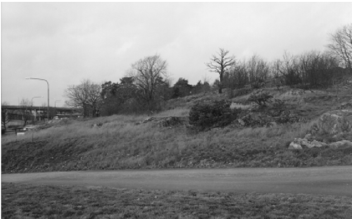
Fig. 6. Den ännu orörda delen av Berga gårdstomt, R203, ligger i slutningen ner mot Årstabergsvägen.

Äldsta skriftliga belägg för Berga by från 1539 års jordebok visar att gården finns kvar in i historisk tid. På 1700-talet ändrar den namn till Zachrisberg. Då den försvinner under 1800-talets mitt är den arrendegård under Årsta.