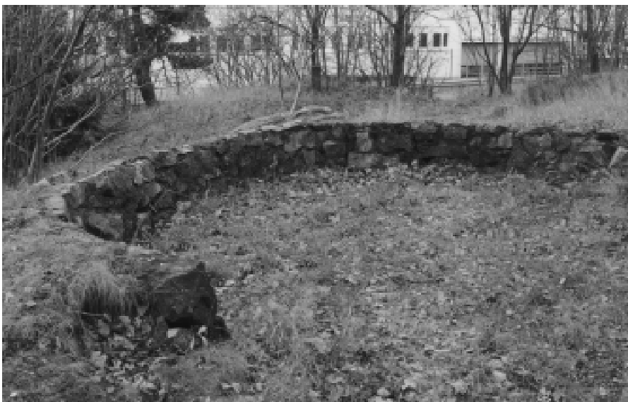
Fig. 14. Det ena av skyttevärnen ligger nära Årsta skolväg. I bakgrunden syns en av industrifastigheterna i Kv. Packrummet.

På två platser inom utredningsområdet ligger skyttevärn från andra världskriget. Det ena i sydslutningen ner mot Årsta skolväg (Karta :19 och fig 14) helt nära den ovan beskrivna gravhögen. Den andra på bergsklacken söder om gamla Vin & spritcentralens f.d. industrifastighet (Karta :18) med utsikt mot Årstabrons fäste. Värnen har troligen byggts för att i en krigssituation kunna kontrollera och försvara järnvägen vid Årstabrons fäste in mot