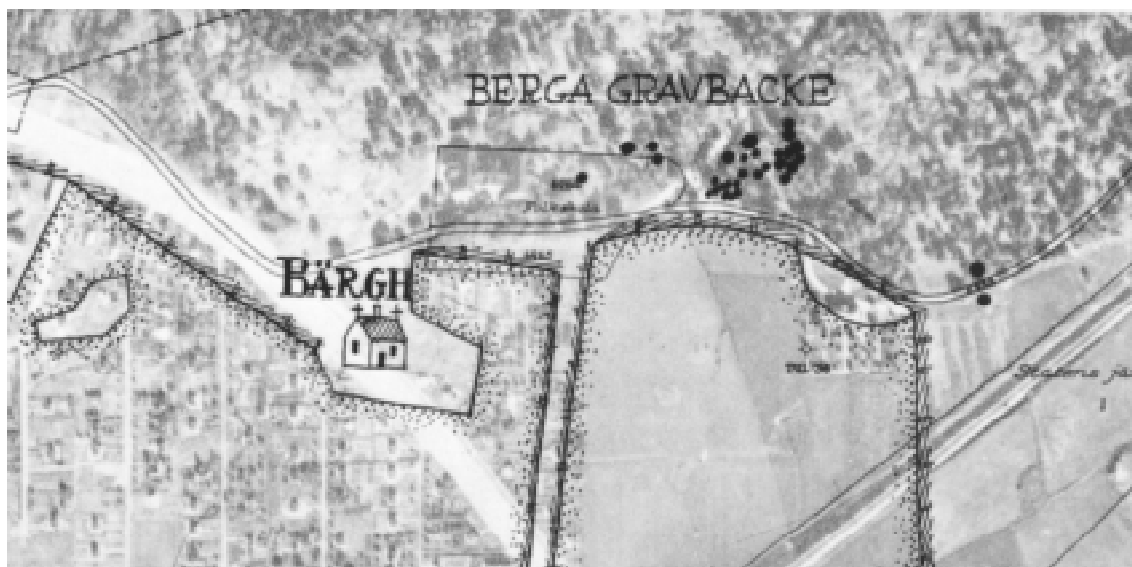
Fig. 5. På 1636 års lantmäterikarta syns platsen för Berga gårdstomt. Bilden visar ett utdrag av denna äldre karta som lagts över en flygkarta från 1937. På överlägget är också gravfältet inritat.

Berga gård hade under förhistorisk tid sin begravningsplats i backen öster om gårds-tomten. Gravfälten (fornlämning nr 5–8 i Brännkyrka sn) som bestod av närmare 40 gravar undersöktes och borttogs 1960 i samband med att industriområdet vid Sjöviks Backe byggdes ut (Karta: 10). De äldsta gravarna är daterade till vendeltid och de yngsta till vikingatid (800–1050 e.Kr). Dateringarna visar att gravplatsen används under minst 400