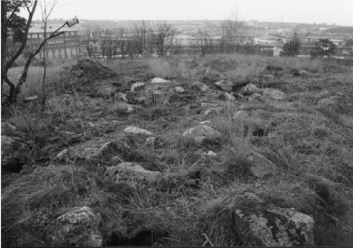
Fig. 2. Från röset (R3) på krönet av Nybodahöjden har man vidsträckt utsikt söderut.