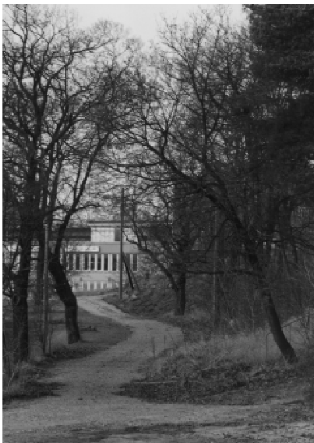
Fig. 10 Årsta skolväg är en del av en gammal vägsträckning mellan Årsta gård och Hägersten.

Den äldsta vägen är den som gått från Årsta gård, via Berga (Zachrisberg) fram till