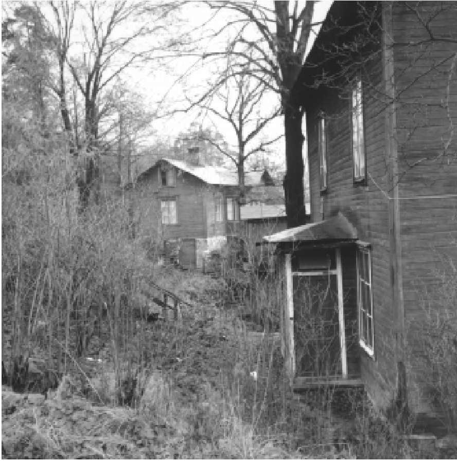
Fig. 7. Tvåvånings träkåkar på Nybodabackens nordsluttning ner mot Sjöviks Backe. Bilden tagen strax innan husen revs 1965.

Sparre, sålde snart därefter ut tomtmark i området på spekulation. Här byggdes den första förortsbebyggelsen till Stockholm, i samband med att industrierna etablerades kring Liljeholmen och behovet av arbetarbostäder växte. Årstadal var ett av flera områden där det växte upp kåkstäder med dåligt byggda flerfamiljshus. De flesta husen låg på den mark som idag upptar industrierna nere vid Årstaviken och på gammal ängsmark upp mot sjön Trekanten. Dess spår är idag helt utplånade. Bebyggelsen fortsatte även upp längs berget i de delar som kallades Årstaskog och Sjöviks backe och spåren efter några av dessa hus finns kvar idag med husgrunder, spismursrösen, terrasser och trädgårdsväxter. Två hela tomter går att identifiera i Sjöviksbacken (Karta :11 och fig 7-8) och två längs bergsslutningen norr om Nybodabacken, -Årstaskog (Karta :12 och fig 9).