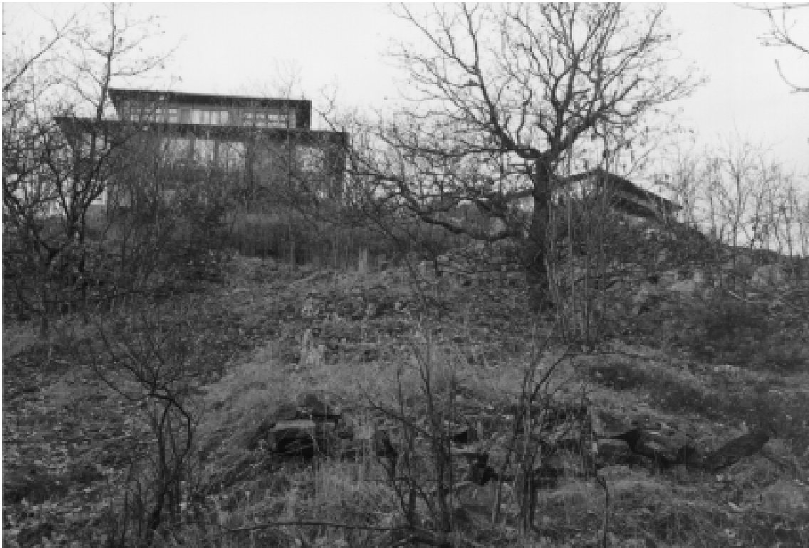
Fig. 8. I Nybodabacken ner mot Sjöviksbacken ligger spismursrösen, grunder och terrasser efter 1800-talet kåkbebyggelse.