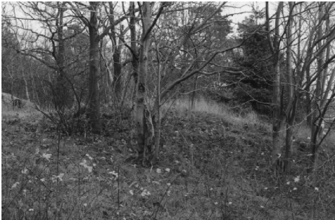
Fig. 4 . Fornlämning nr 10 ser ut som en gravhög från järnåldern, men döljer kanske en skärvstenshög från bronsåldern.

Den kvarliggande högen, ligger vackert i ett av lövskogsbältena som omger områdets bergklackar, kan antingen vara en skärvstenshög eller kan den höra samman med det gravfält från yngre järnåldern som beskrivs nedan.