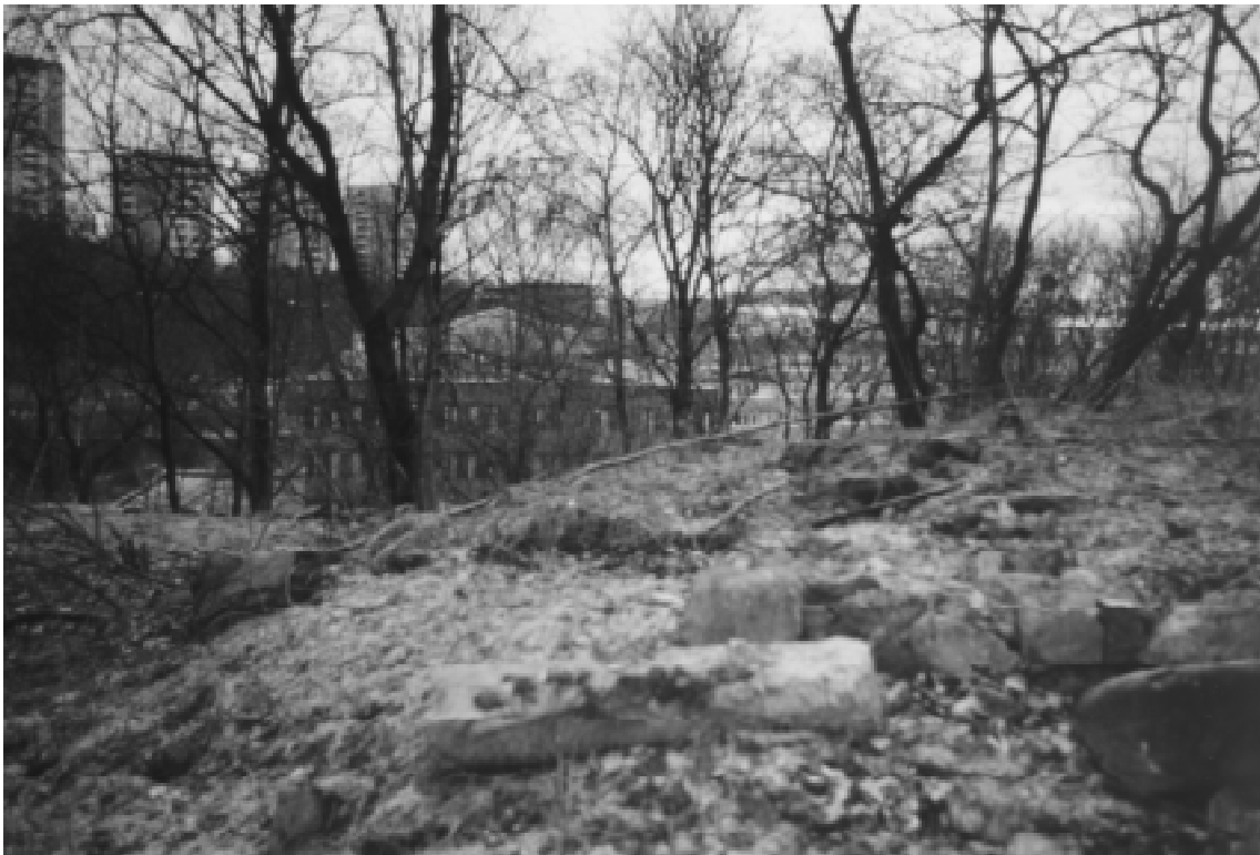
Fig. 9. På nordsluttningen av Nybodabacken låg kåkbebyggelsen Årstaberg. Trädgårdsrester och bebyggelse-lämningar till två tomter ligger ännu kvar i slätten.