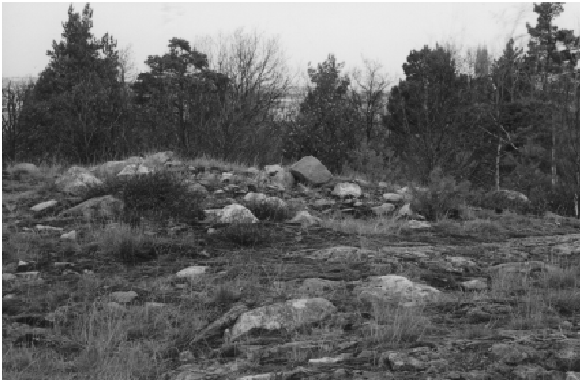
Fig. 3. Röseliknande stensättning (R9) beläget på utredningsområdets högsta punkt.