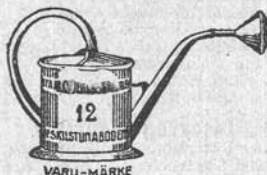
A.-B. Eric Cederlöf, Eskilstunaboden