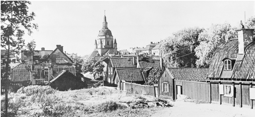
FIGUR 8. Stigbergsgatan västerut mot Katarina kyrka i bakgrunden. Byggnaderna nederst i backen är från tidigt 1700-tal. De stod ursprungligen separerade från varandra men byggdes ihop under 1800-talet. Foto omkring 1910. Ur: Odlander & Kihlborg 1982, s. 82.

befolkningsdensitet, sliten gårdsbebyggelse och ett irrationellt slingrande gatunät torde ha medfört ytterligare ett moment i risktagandet med en hårdare militär insats. Resonemanget kräver dock en djupare inblick i den miljö som omgav upploppet för att kunna verifieras. Nedan görs därför en ansats till en beskrivning av kåkarna och livet på glasbruksgatorna. Syftet är att bättre kunna förstå både myndigheternas agerande och upploppets förutsättningar och händelseutveckling.