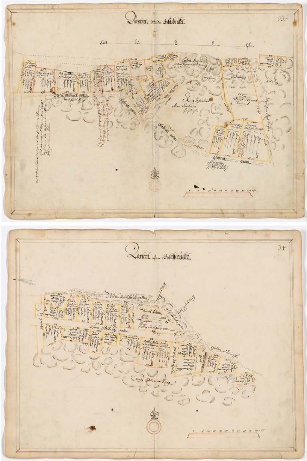
FIGUR 6 & 7. Stadsingenjören Johan Holms kartor över kvarteren Nedre, respektive Övre Glasbruket. Kartorna är från 1674 men tomtindelningen torde ha bestått relativt oförändrad långt in på 1700-talet. Holms tomtbok. Södra förstaden östra, 1674, SSA.