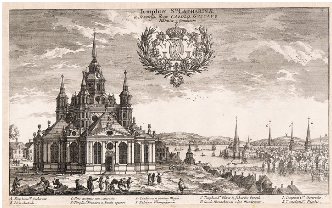
FIGUR 4. Katarina kyrka uppfördes under 1600-talets andra hälft. På slutningen nedanför kyrkan syns några av husen i kv. Glasbruket övre sticka upp.

tillstädes, kommenderat pojkarne att riva ner luckan på huset. Och när pojkarne först dragit upp dörrarna skola officerare och gardeskarlar gått in i huset, begynnades därpå att slå ut fönstrena och ruina allt vad som fanns i Maja Ihre stuva.