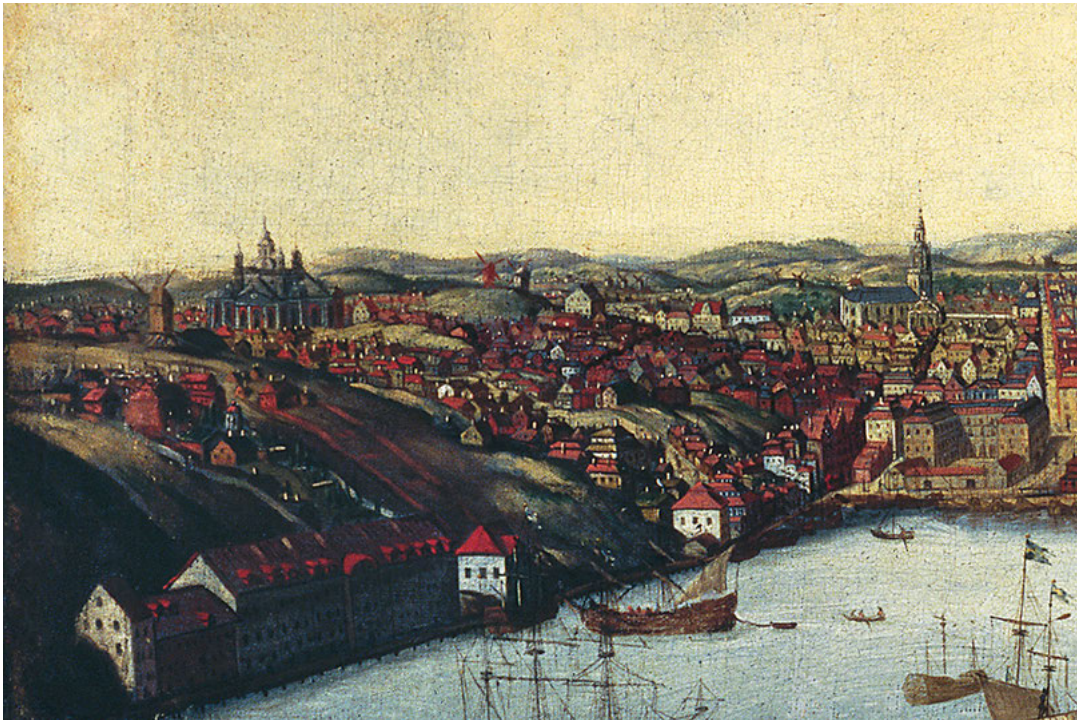
FIGUR 1. Östra Södermalm omkring 1700. Till vänster uppe på berget syns Katarina kyrka med glasbrukskvarterens oregelbundna trähusbebyggelse på sluttningen ner mot Saltsjön. Utsikt över Stockholm från Kastellholmen. "Swiddetavlan" (efter Willem Swiddes kopparstick i Suecia antiqua ), detalj, SSM.

dess kvarter. Vilken betydelse kan topografin, och inte minst trångboddheten, ha haft för sexualitetens och det odygdiga livets gränser mellan offentligt och privat? Och hur har det i sin tur påverkat det vardagliga livet och upploppet vid glasbruksgatorna?