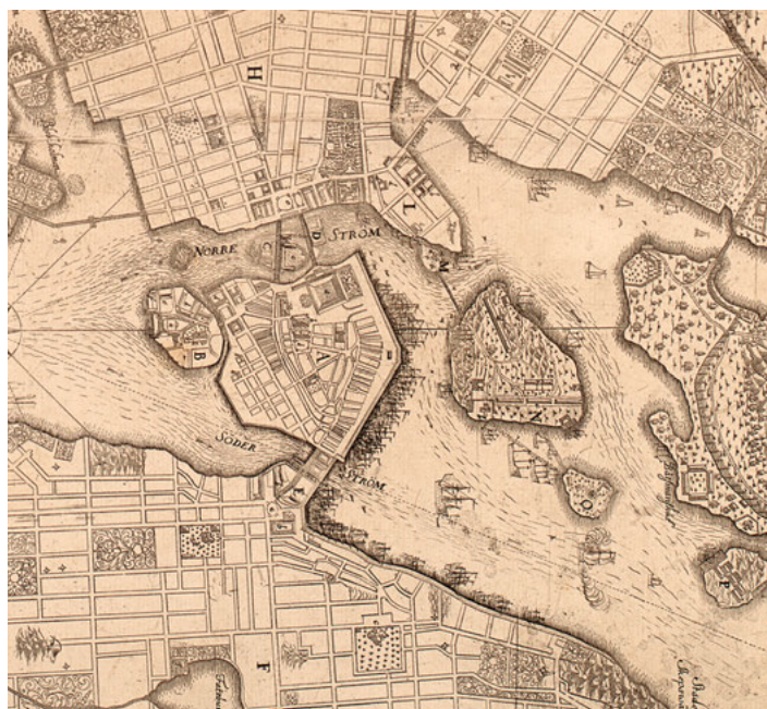
FIGUR 2 & 3. Två Stockholmskartor. Den övre visar Stockholm 1642. Norrmalm är redan en reglerad kvartersstad med rätvinkligt gatunät, medan bebyggelsen söder om Gamla stan ännu är kvar i sin äldre oregelbundna form. På Wijkmans karta från 1702 syns att staden nu har expanderat och även de svårtillgängliga områdena uppe på Söders höjder har bebyggts. Men detta har skett oreglerat och gatorna på bergen följer krokigt den oländiga terrängen. Centrala Södermalm har dock genomgått en kraftig förändring och gatunätet är i stort sett detsamma som idag. Karta över Stockholm 1642 och Wijkmans karta 1702, båda SSA.

60-talen ömsade Stockholm skinn och kom ut som en större, starkare och mer välmående stad än någonsin tidigare.