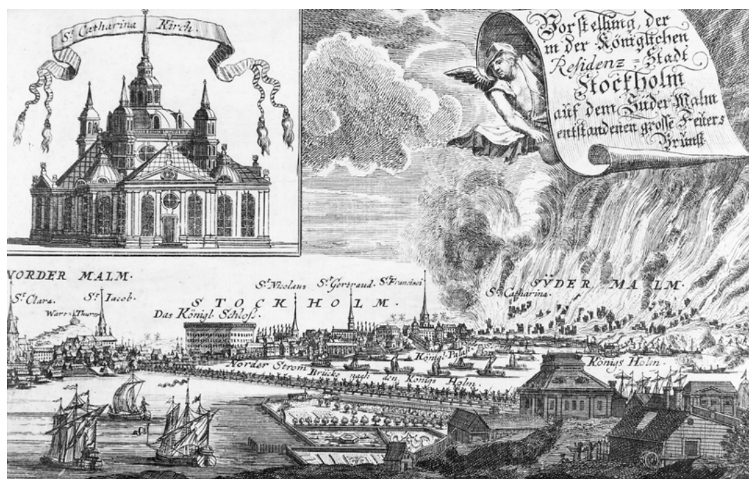
FIGUR 9. Den 1 maj 1723 drabbades stora delar av östra Södermalm av en våldsamt brand. Mer än 300 gårdar förstördes. På grund av de dåliga tiderna och och bristen på byggmaterial gick återuppbyggnaden sedan mycket långsamt. Bebyggelsen omedelbart norr om kyrkan – däribland glasbrukskvarteren – klarade sig, troligen på grund av vindriktningen in från skärgården, undan branden. Katarinabränden 1723, kopparstick, SSM.

1719 var dock inredda vindar ännu ovanliga. Utrymmena ovan innertaket nyttjades inte till annat än isolering och viss förvaring. Rummen var små, storleken avgjordes av timmerstockarnas längd. I köket brann en eld i spisen vilket försåg huset med värme. Kakelugnar gjorde inte entré i Stockholms fattigare kvarter förrän under andra hälften av 1700-talet. Vatten hämtades i saltsjön eller på Mälarsidan eller i de brunnar som fanns i den nedre delen av staden och släpades uppför backarna. Södermalmsupploppets hastigt expansiva förlopp underlättades av den höga befolkningsdensiteten som i samband med de svåra livsvillkoren samtidigt även försvårade ordningsmaktens ingripande.