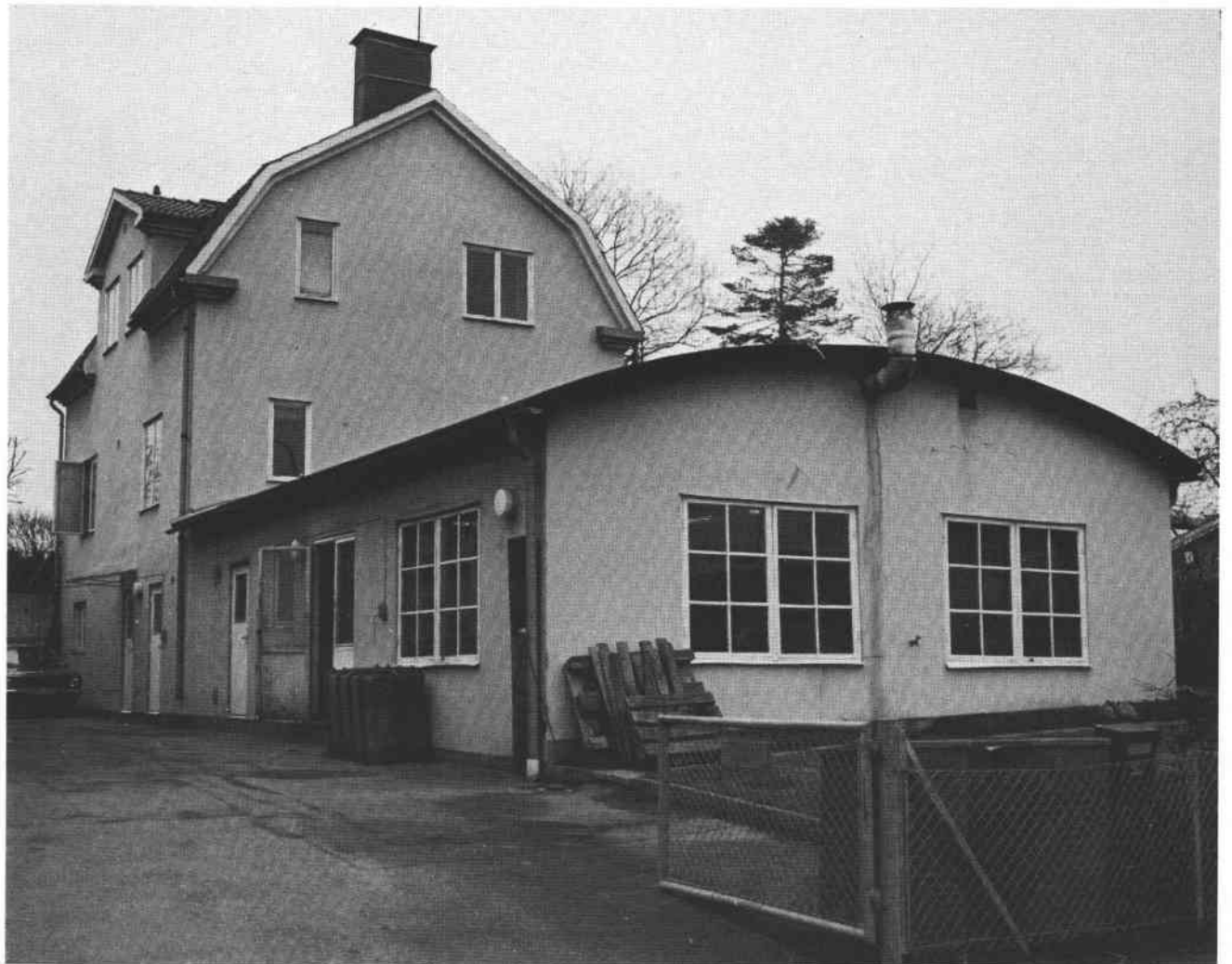
FB 14 546