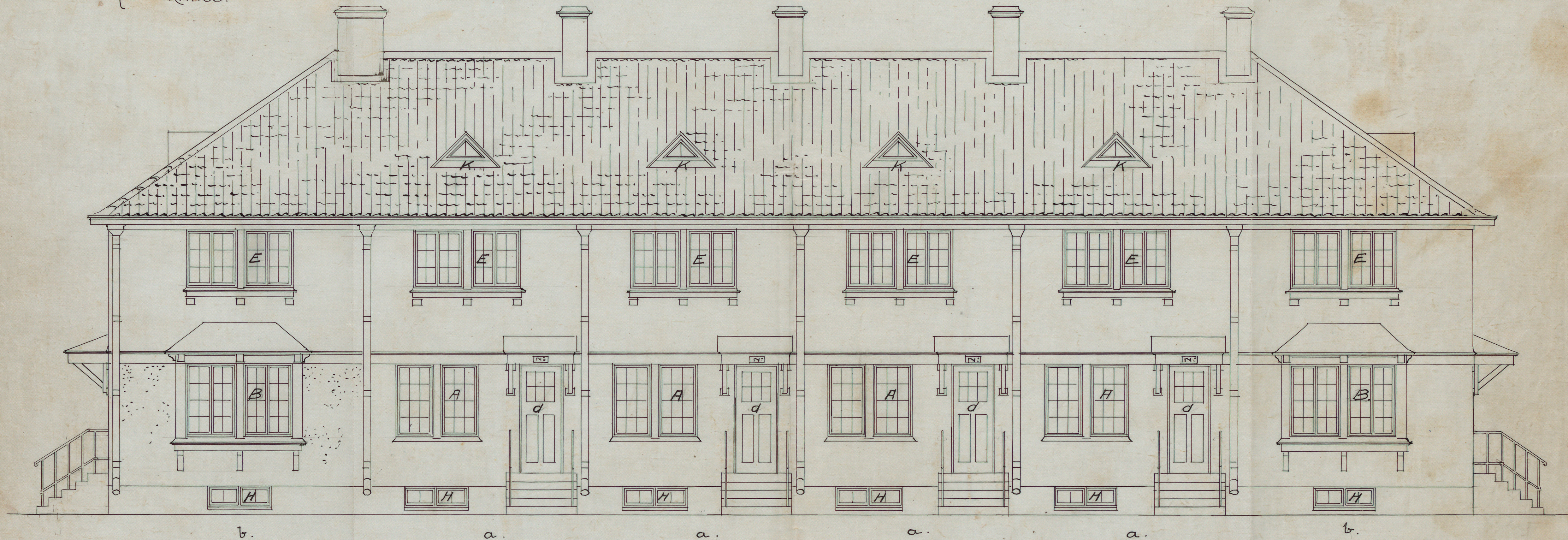
· FASAD · MOT · GATAN ·

Nr. 4. Kv. Inspektions 1. RITNING TILL ENFAMILJSHUS (RADHUS) TYP I { a. MELLANHUS b. HÖRNHUS.