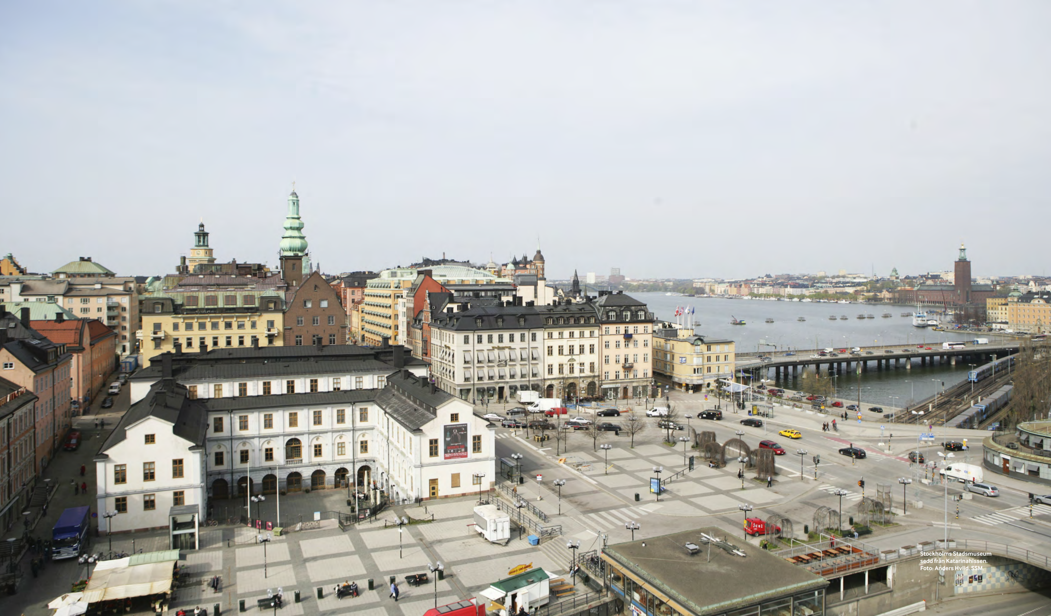
Stockholms Stadsmuseum sedd från Katarinahissen.