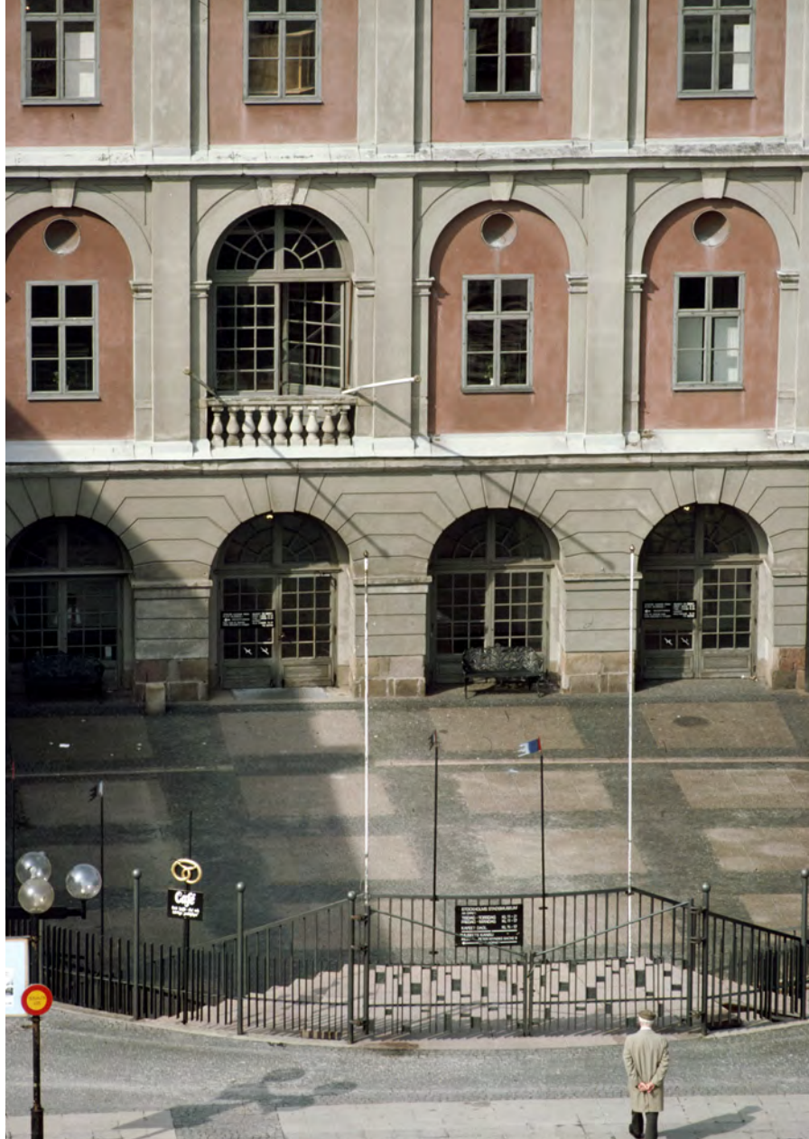
Stockholms stadsmuseum efter restaureringen i början av 1960-talet. Borggårdens bågöppningar och den mitterska bågen på första våningen har glasats in.

och köpte lin. En betydande del av den norra flygeln togs redan från starten i anspråk av källarmästare, vilka skapade den med tiden välkända Södra stadshuskällaren som fortlevde i huset fram till 1800-talets mitt. Dess voluminösa vinkällare fanns i huvudlängans två stora valvrum på båda sidor om trapphuset.