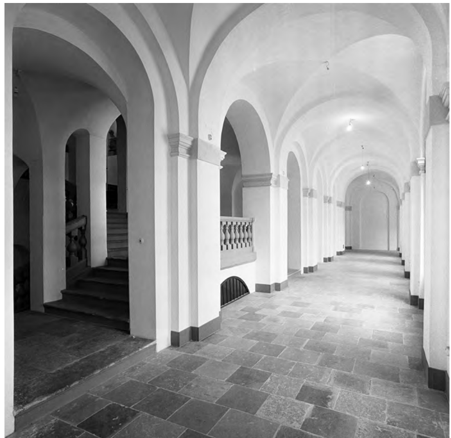
Korridoren och ett parti av trapphuset återställdes under restaureringen 1962–1963.

»År 1932 flyttade den nybildade Stadsmuseikommittén in i två rum i byggnadens sydvästra del. Det var embryot till Stockholms stadsmuseum.«