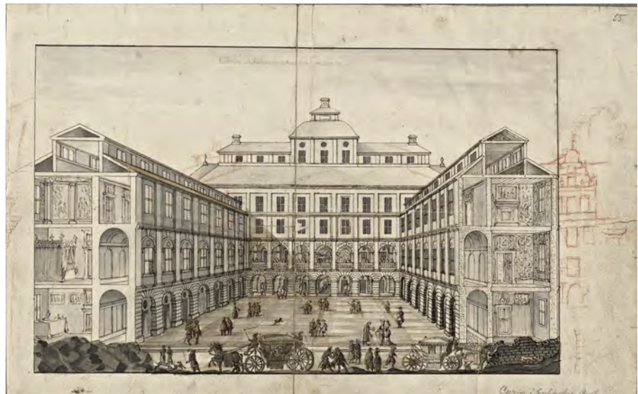
Södra stadshuset. Denna sällan återgivna förlageteckning till Sueciaverket från omkring år 1687 visar huvudbyggnadens ursprungliga takutformning som sedan modifierades i det färdiga kopparsticket. Flyglarna redovisas i genomskärning eftersom man ville betona att byggnaden skulle bli avsevärt större. Kungliga biblioteket.

När Södra stadshuset togs i bruk flyttade flera förvaltningar och kontor in. Södra kämnärsrätten var en av dem, men även det nyinrättade Politiekollegium, embryot till vårt polisväsende, Ämbets- och byggningskollegium med flera. Flera av magasinerna runt stadshusgården hyrdes av olika handelsmän, varav flera var »linkrämare«, det vill säga sålde