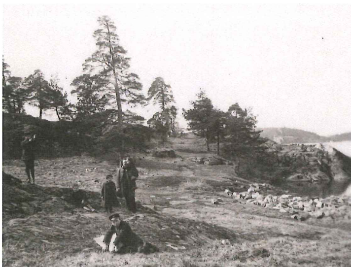
Platsen där Hornsbergs villastad tänktes placerad.

Nordvästra Kungsholmen kunde idag ha sett annorlunda ut. Albert Lindhagen, esplanadsystemets fader, hade sina motståndare. Alla var inte övertygade om den nya stenstadens förträfflighet. Inte bara att regelbundenheten, raka gator och rektangulära kvarter, ansågs skapa monotoni och tristess; hopandet av folk i stora massor kunde leda till fysiskt och moraliskt fördärv och hota samhällskroppens sundhet. Bote-medlet var att göra invånarna delaktiga av landets rikliga tillgång på ljus och frisk luft, att införa naturen i staden. Det räckte inte med närliggande stadsparker, alla borde ha tillgång till en egen, för själen och kroppen livgivande trädgård.