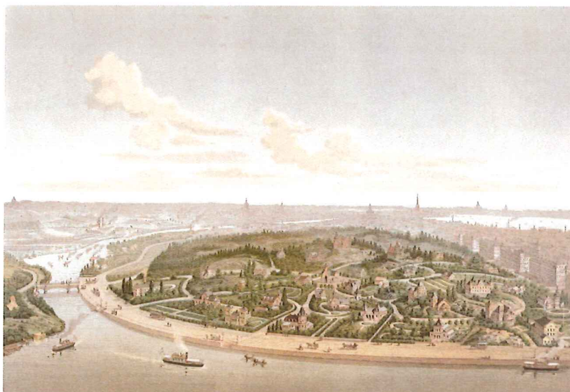
Förslag till Hornsbergs villastad på nordvästra Kungsholmen, färglitografip panorama 1886.

Belägen intill Karlbergskanalen, på sluttningen ner mot Ulvsundasjön, var den nya villastaden planerad som en böljande blomma med centrumkalk och kronbladskvarter. Kvartersnamn som Tillflykten, Lyckan, Paradiset och Fristaden tänktes göra den lilla oasen extra tilltalande. I ett visionärt färglitografipanorama målades upp en burgen idyll, på behörigt avstånd från den larmande storstaden. Men den lilla utopin blev aldrig verklighet. Endast ett par hus byggdes. Med dåliga kommunikationer – en ångslupslinje planerades – var platsen alltför avlägsen. I bakgrunden, längs Klara sjö och Karlbergssjön, stack dessutom upp rykande fabriksskorstenar och på andra sidan villastaden närmade sig rader av hyreslängor för den växande arbetarbefolkningen. Kungsholmen hade heller inte det bästa rykte; det var en arbetarstadsdel – med liten pastoral potential.