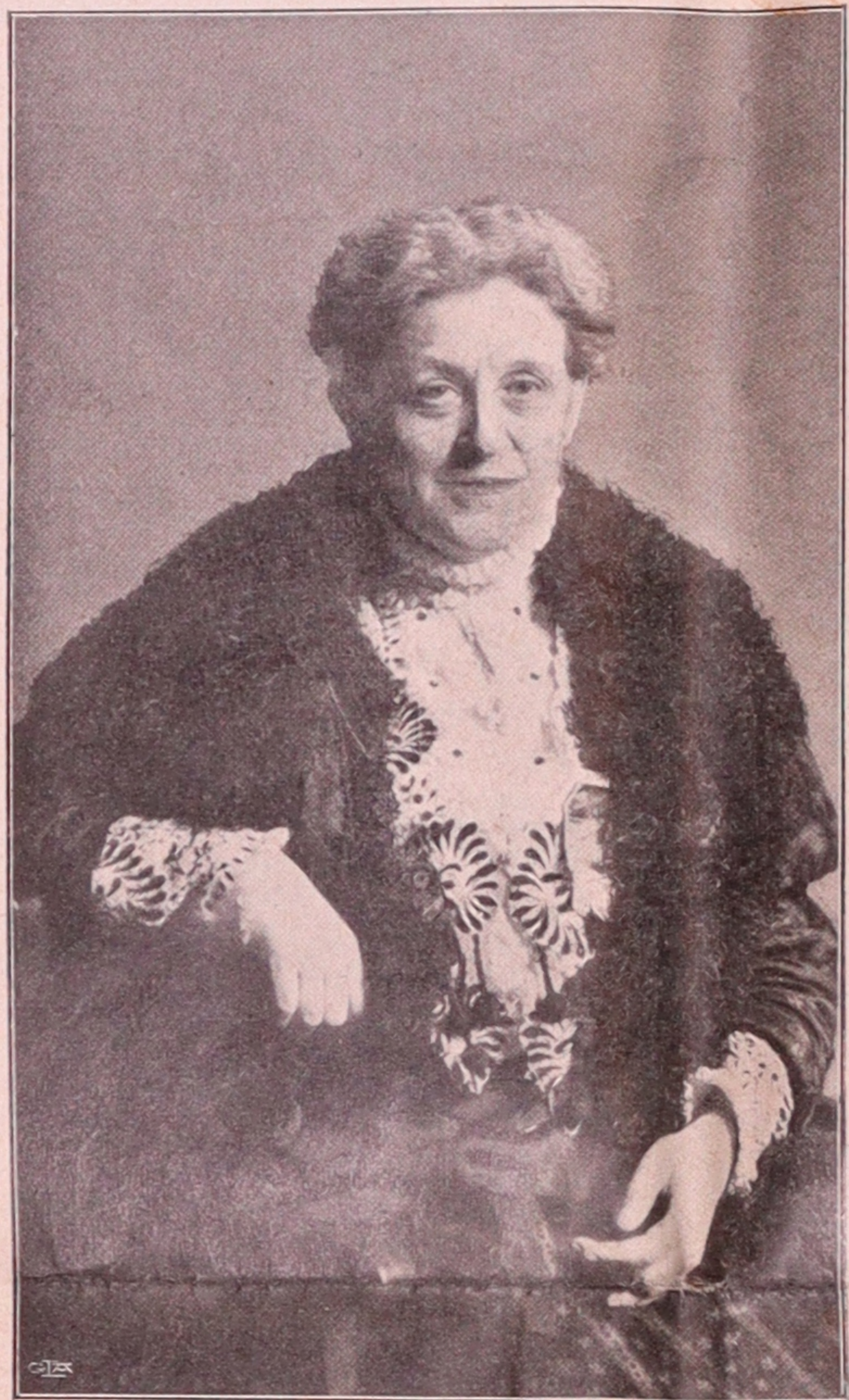
CARRIE CHAPMAN CATT. Ordf. i Internationella kvinnorösträttsalliansen.

Men jag, som ändå "skrivit många värktum" med syfte att ge litet av vad vi kände av andakt och rörelse, av glädje och beundran, med syfte att låta er veta, hur det var befriande högt till taket och hur lätt att andas i vårt stora internationella rösträttshus, jag misstänker att allt detta är något, som fortfarande är eder fördolt. När jag möter människor, som säga: Det var väl roligt i London, ser jag så sällan den heliga