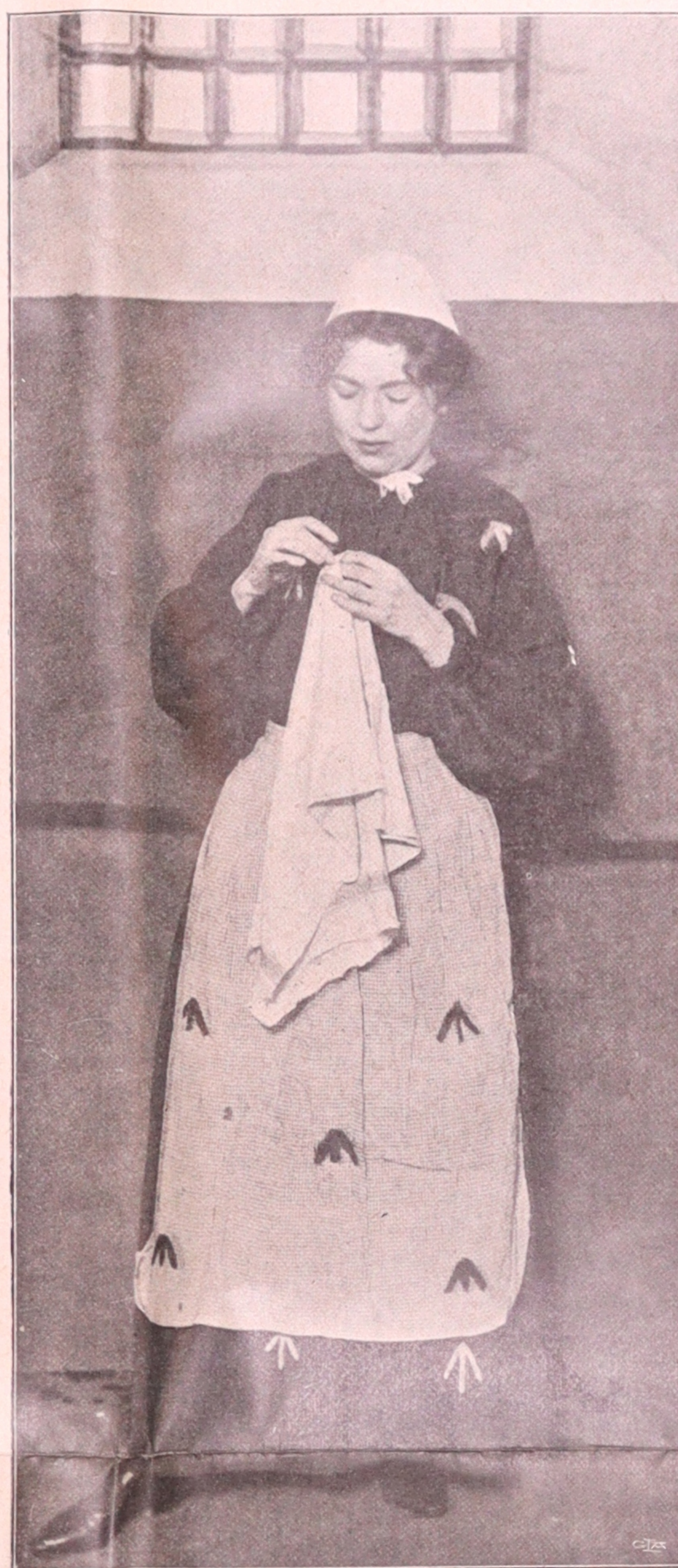
SUFFRAGETT I FÅNGELSE.

mot två så stora grupper av medborgare har ock samhället erkänt sin egen ofullkomlighet. Nog måtte väl var och en förstå, att det är något sjukt med hela samhällskroppen, då den icke tror sig om förmåga att fostra egna medlemmar till ansvar. Men kan då ansvarskänslan höjas genom ständigt misstroende! Och kunna samhällets lyten någonsin avhjälpas, då icke de som lida mest därunder — kvinnorna — släppas fram för att påvisa dem.