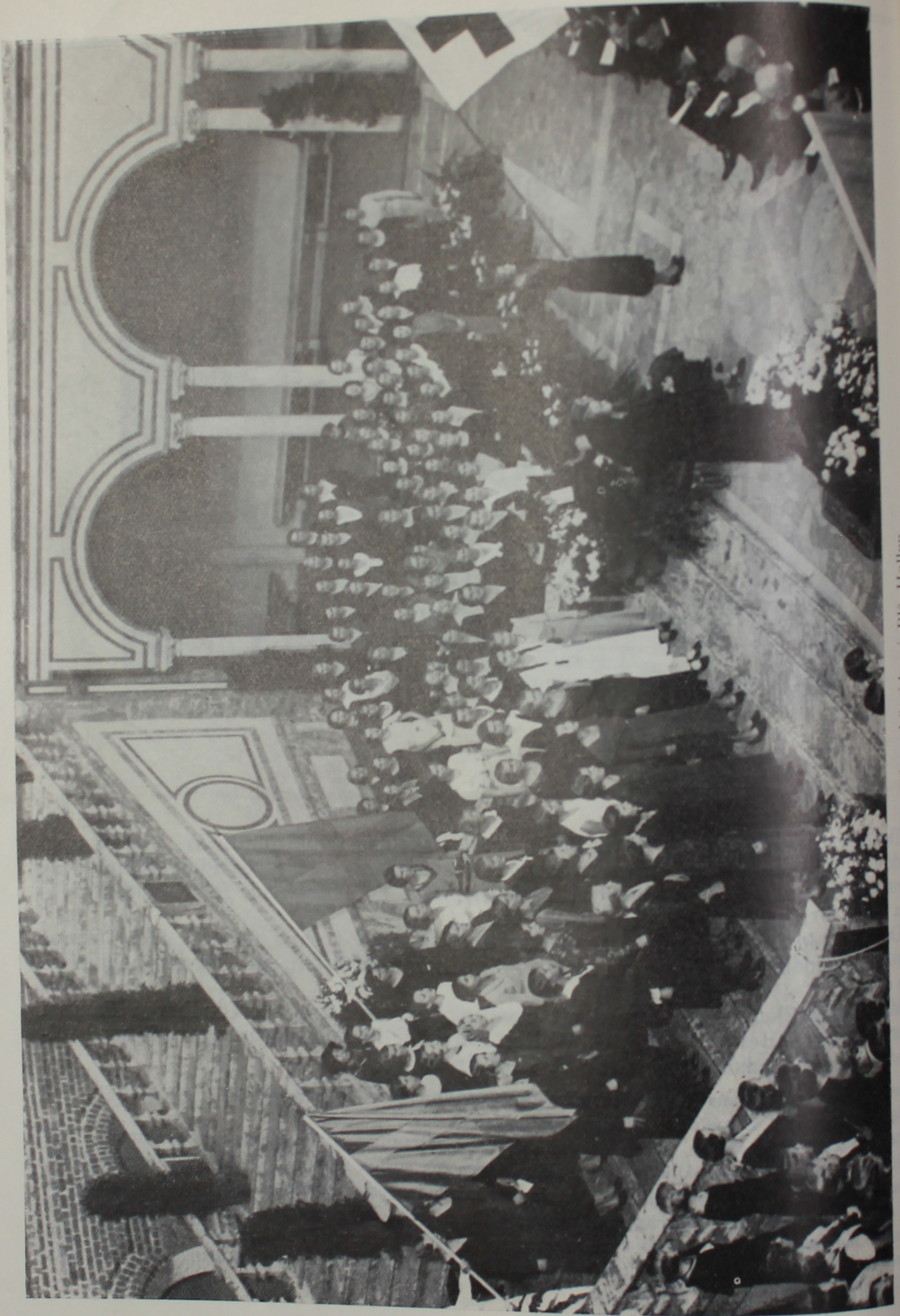
Minneshögtiden i Blå Hallen.