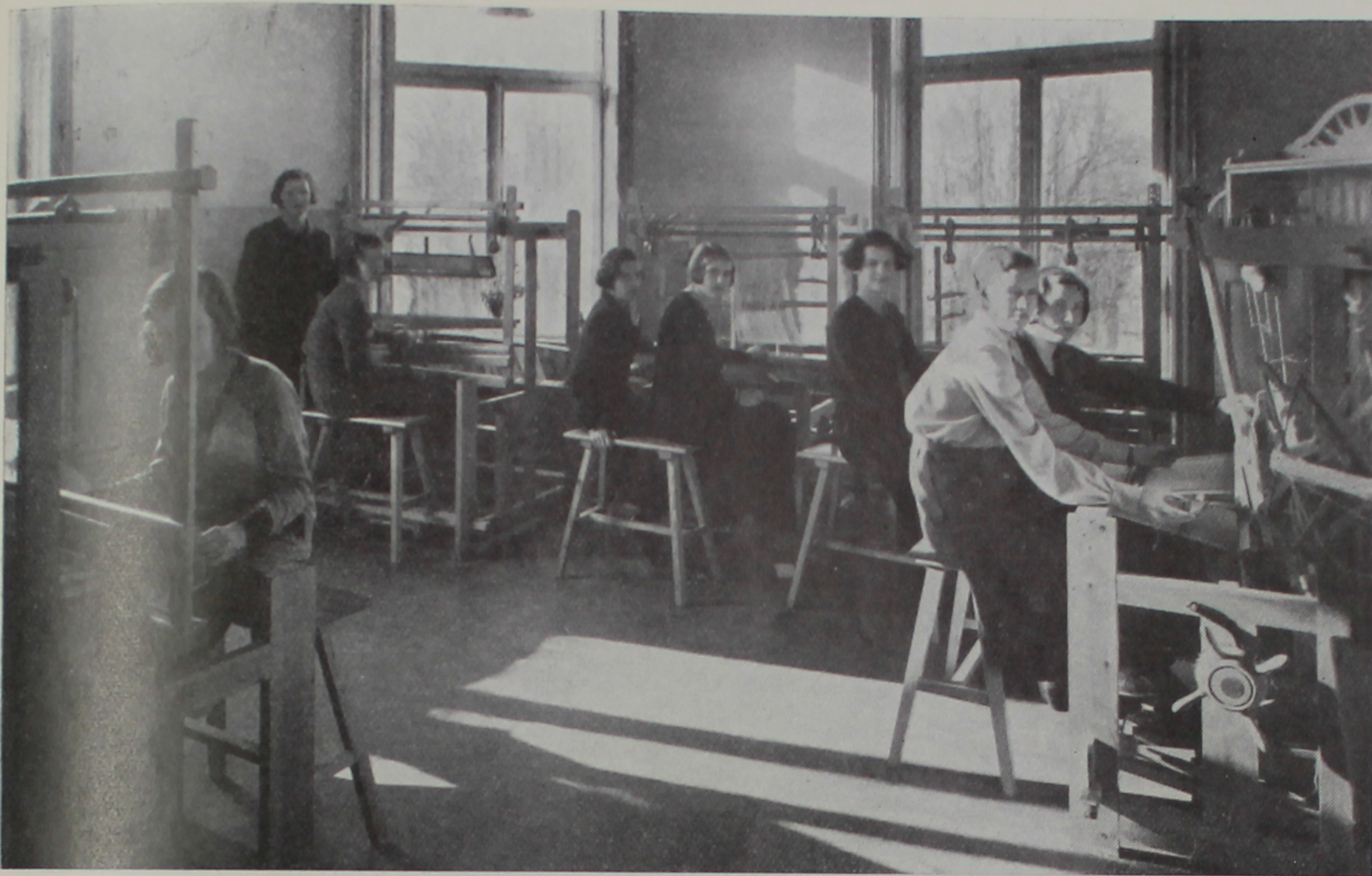
Ett av de fyra vävrummen.