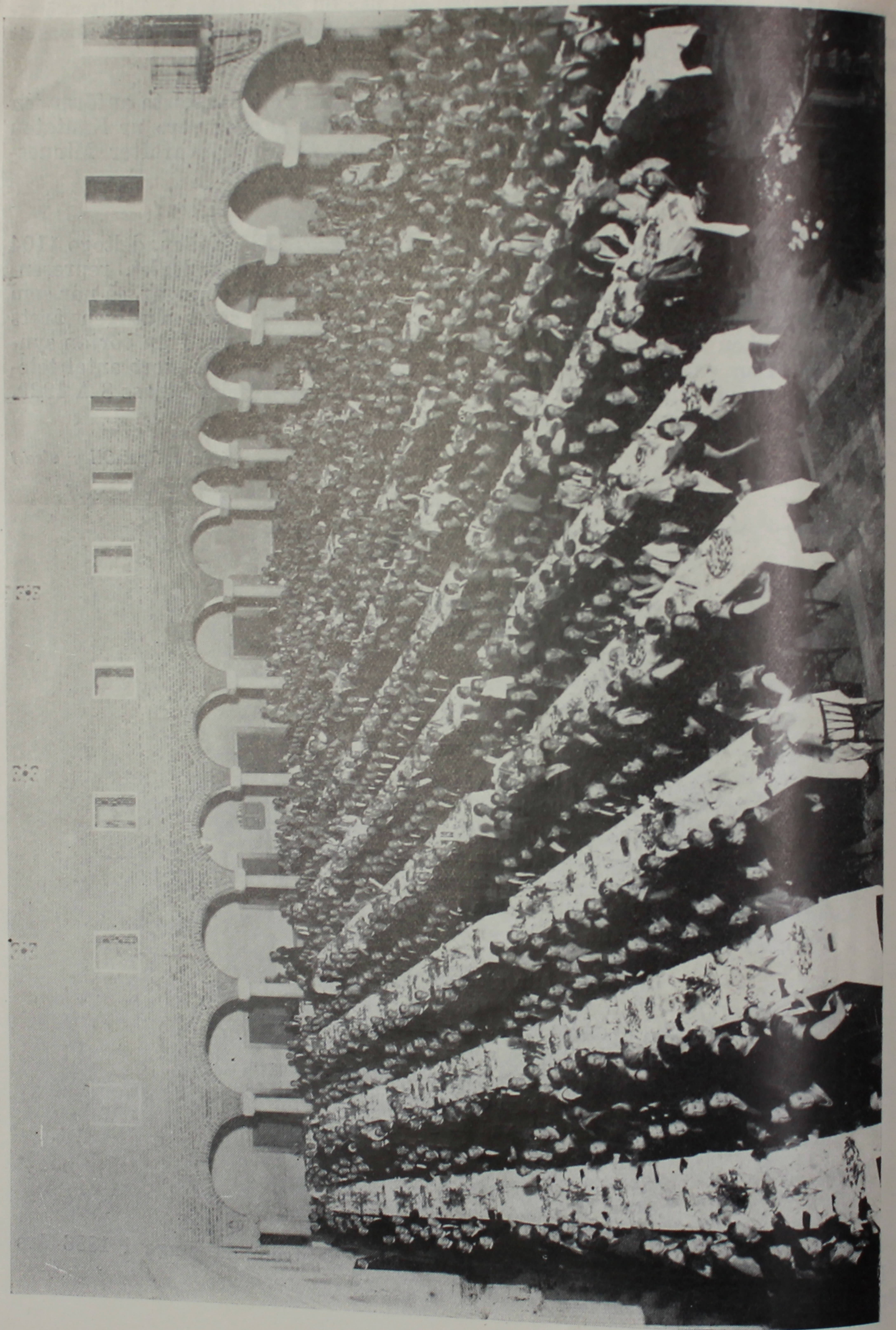
Kamratfesten i Blå Hallen.