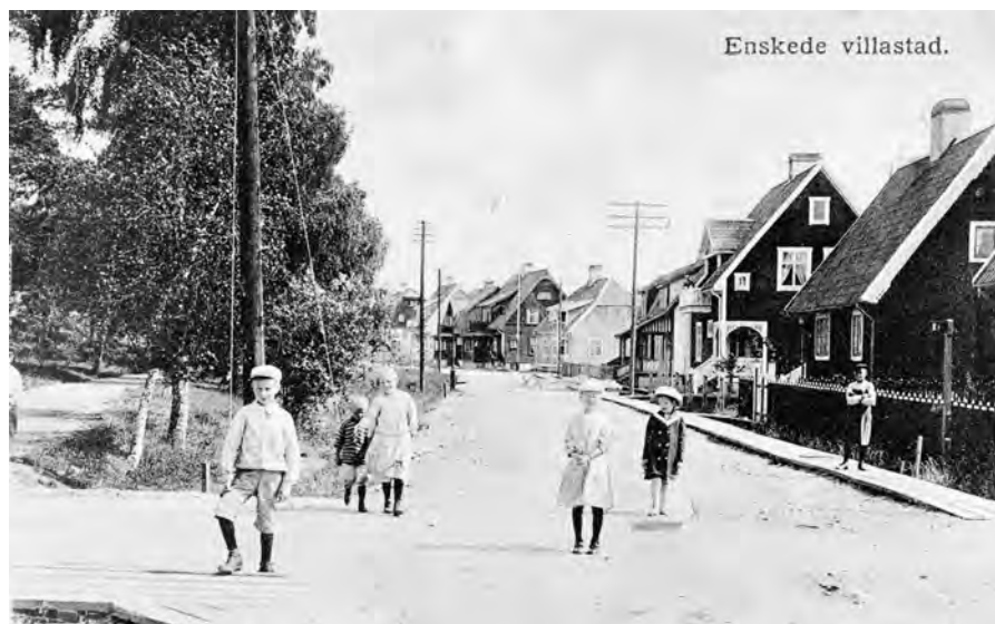
Nybygggarbarn på Margaretavägen med Margaretaparken till vänster och kvarteret Höbärningens villor från år 1909 till höger. Fotot är taget år 1914.

De första villorna byggdes genom Lantegendomsnämnden men sedan också av enskilda bolag som AB Stockholms Trädgårdsstäder och AB Hem på landet. En ny lag om tomt-rätt gjorde det möjligt att in-teckna och belåna husen genom det nyinrättade kreditinstitutet, AB Stockholms Tomträttskassa. Precis som de styrande hade tänkt sig bidrog detta till att »vanligt folk« kunde köpa en tomt och bygga hus här. För många barnfamiljer blev det egna hemmet med liten täppa ett alternativ till innerstadens mörka, trångbodda hyreskaser-ner. Villor byggdes nu i rasande fart, många av husägarna själva. En stor del av nybyggarna var hantverkare: timmermän, snickare eller murare. Redan år 1911 menade man att det var »ett hastighetsrekord i svensk stadsbildning, vars make endast är jämförlig med eller kan påvisas i Amerika«. Omkring 450