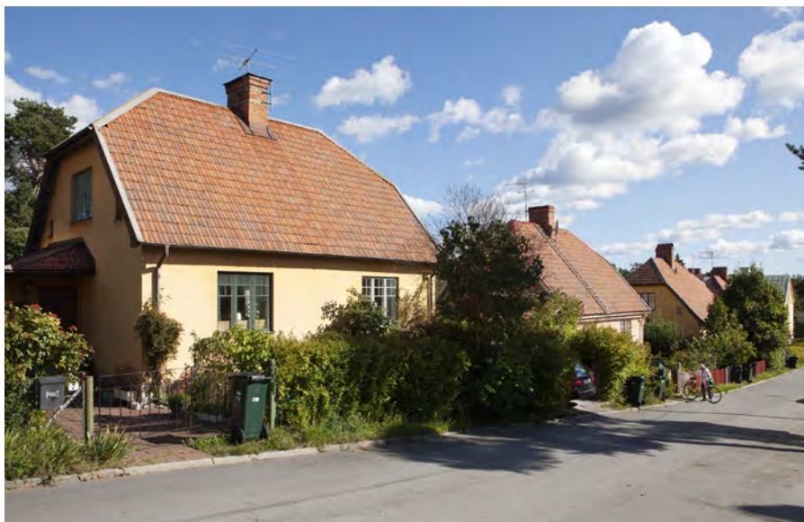
Backvägen norrifrån med några av stadsdelens många parhus eller dubbelhus, i början ett betydligt populärare alternativ än radhuset. De var ofta kalkputsade i en ljus kulör, en och en halv våningar höga med brutet tak klätt med tegel. Foto: Göran Fredriksson. 2011. SSM.

P å Enskede gårds gamla ägor kom också Enskede villastad att ligga, Sveriges första så kallade trädgårdsstad som började byggas år 1908. Trädgårdsstaden ansågs vid denna tid vara den framtida boendeformen. Här skulle man bo en bit utanför den egentliga staden, i småhus, radhus eller mindre flerfamiljshus med trädgårdar och mycket grönska. Enskede var samtidigt det allra första exemplet på kommunalt planerad egna-hemsbebyggelse, byggt efter internationella förebilder. Planarkitekten Per Olof Hallman var inspirerad av både tyska och engelska villaförstäder. Stadsplanen anpassades efter terrängen och en skogklädd liten höjd mitt i stadsdelen blev park, Margaretaparken. De mjukt svängda gatorna skapar intressanta gaturum och de så kallade krokarna – små gemensamma parker som ligger här