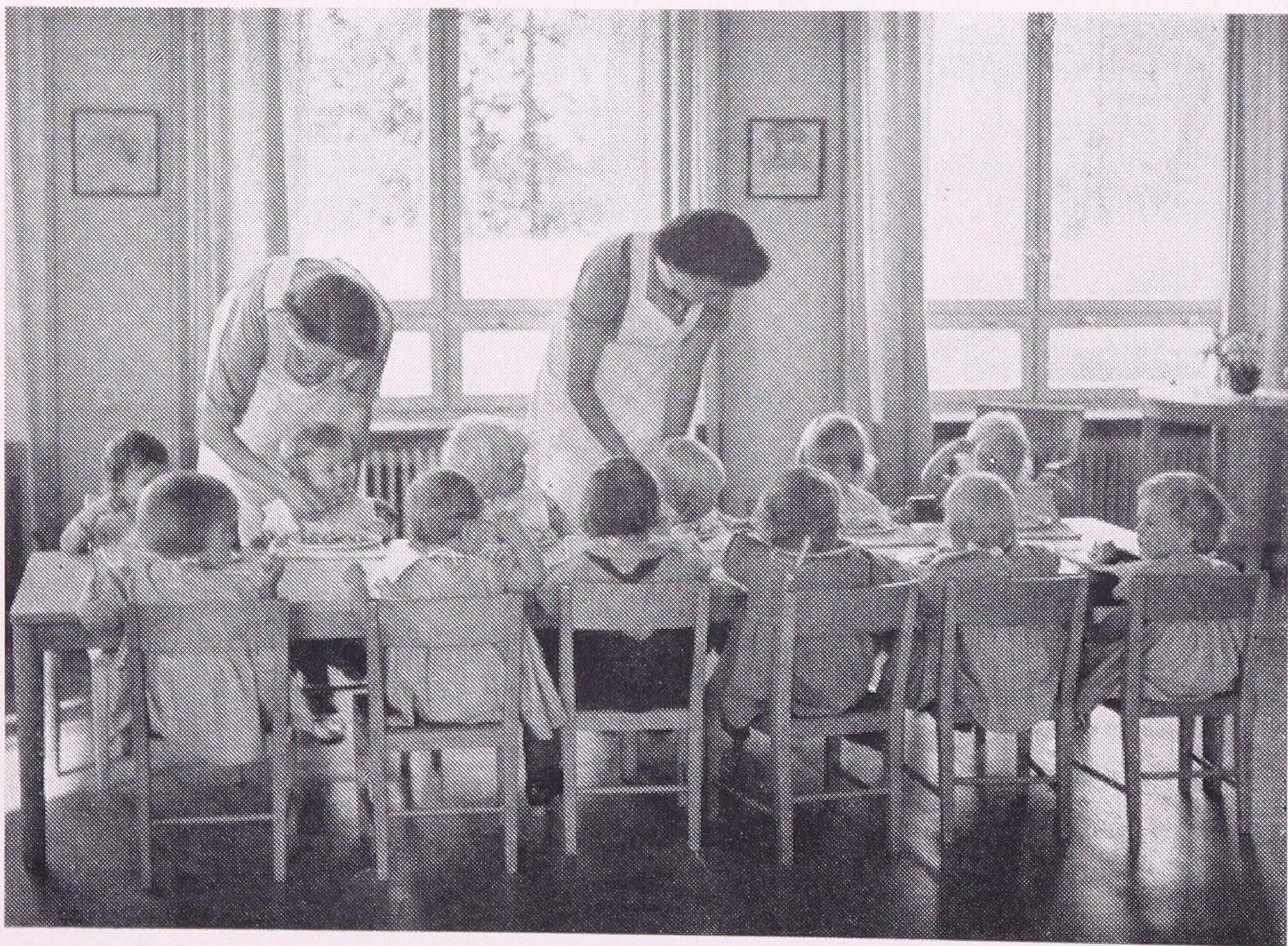
Matsalen i Småbarnshem I.