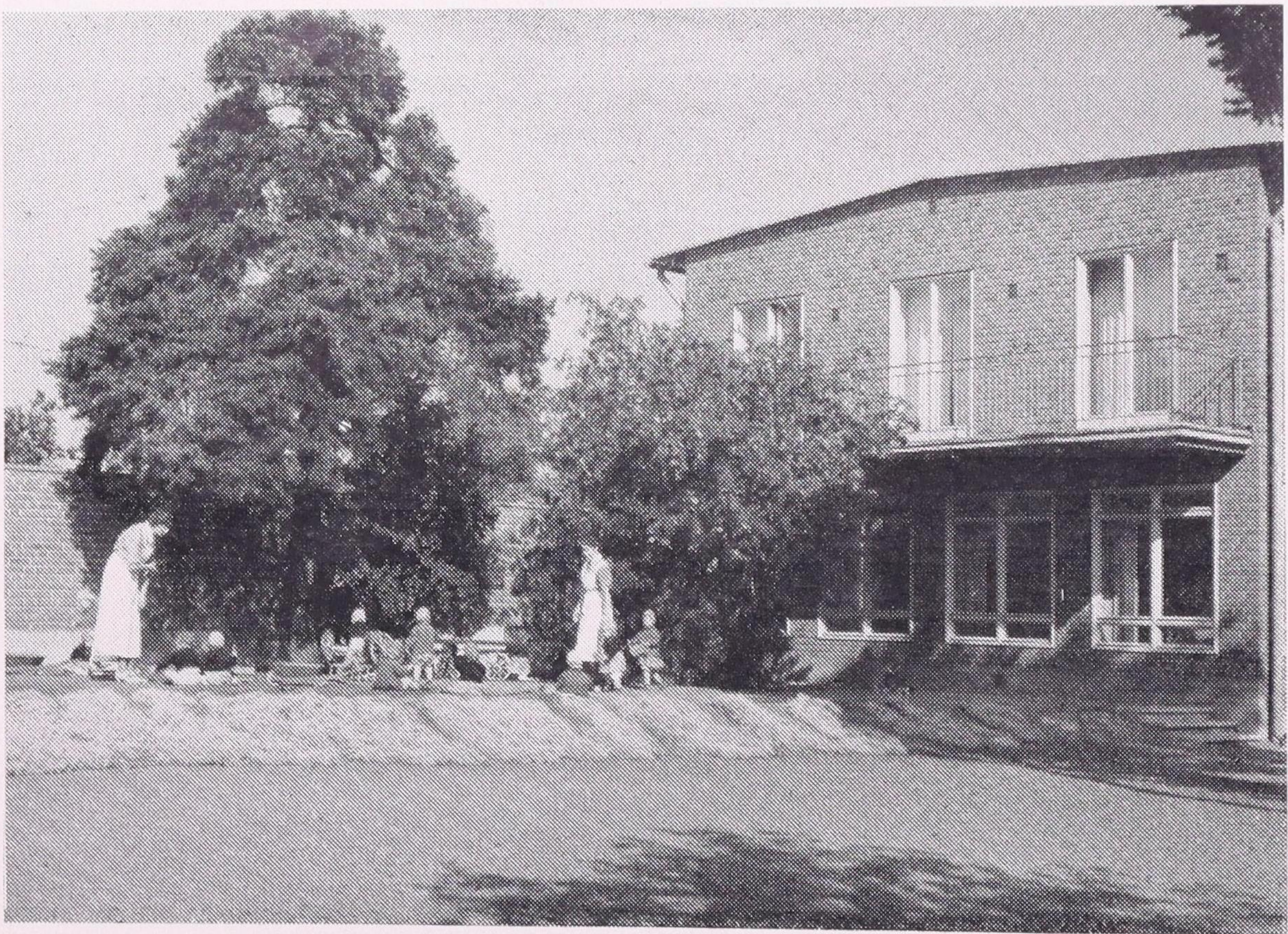
Småbarnshem I. Terassen med vindskyddsmuren.