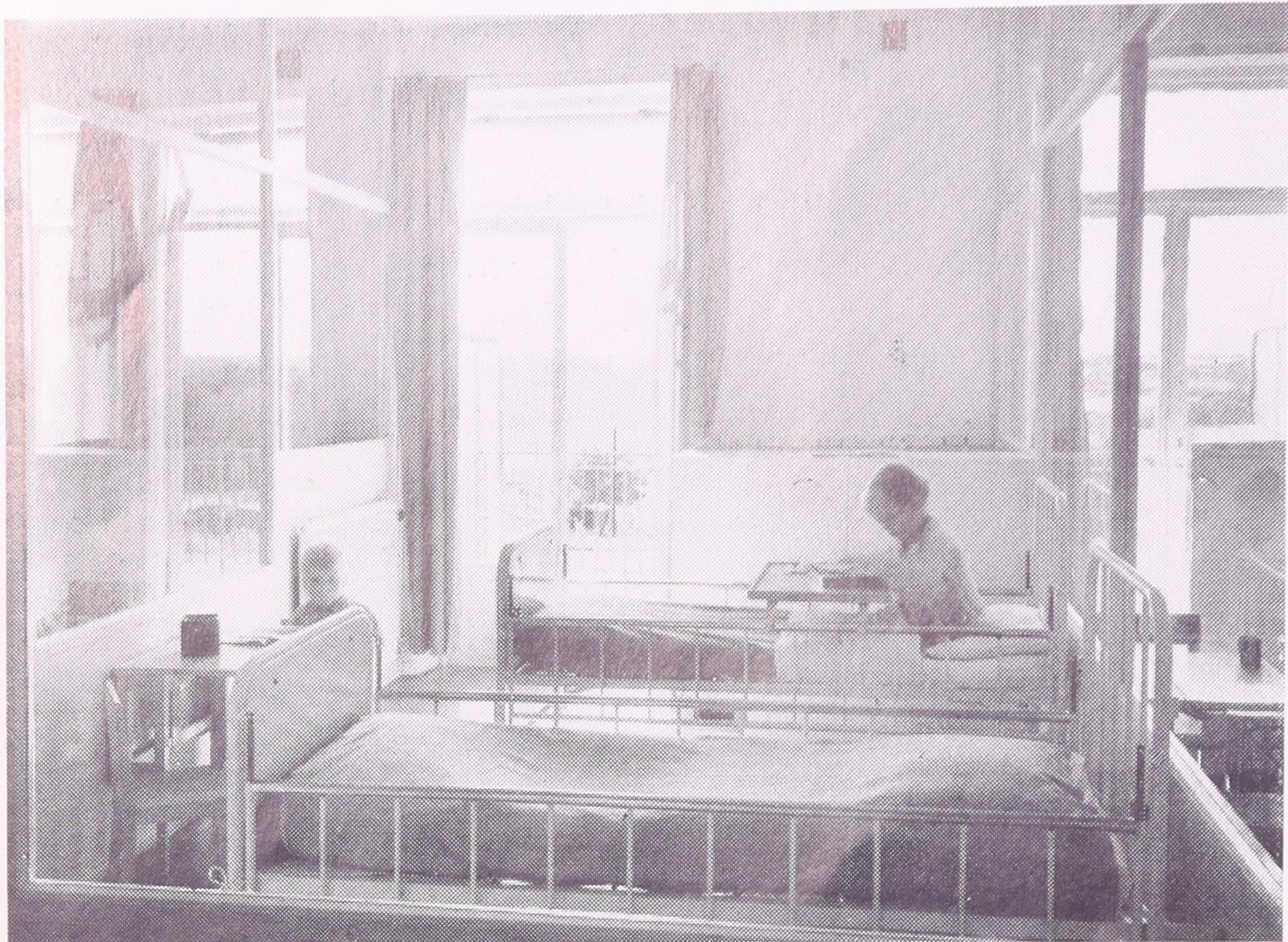
Interiör från Observationspaviljongen.