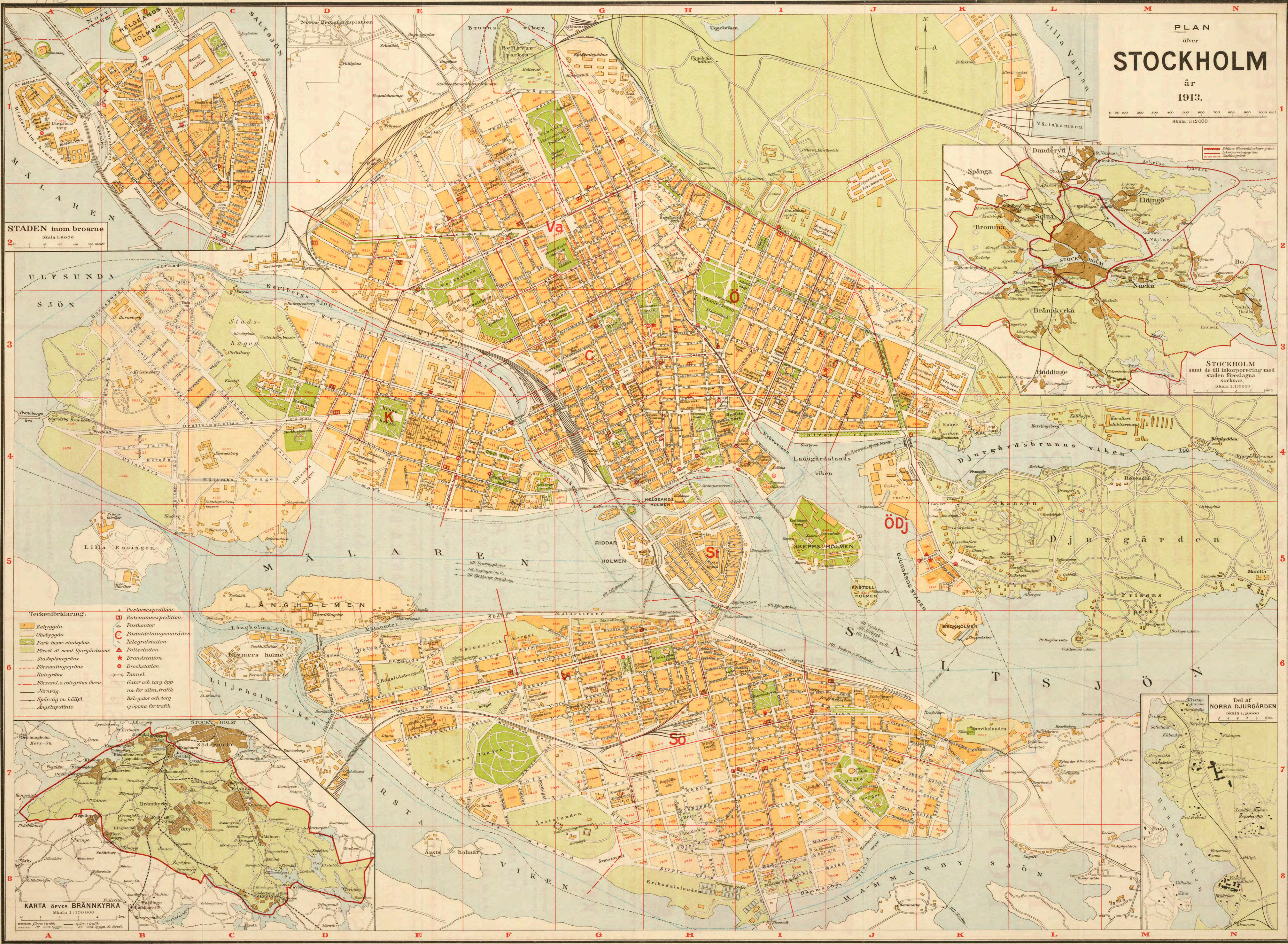
STADEN öfver broarne Skala 1:60 000