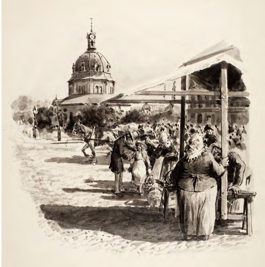
Teckning av torget. I bakgrunden Hedvig Eleonora kyrka. Kyrkan började byggas år 1658 och invigdes år 1773.

1978 Kar de Mummas revyer. Teatern revs år 2003.