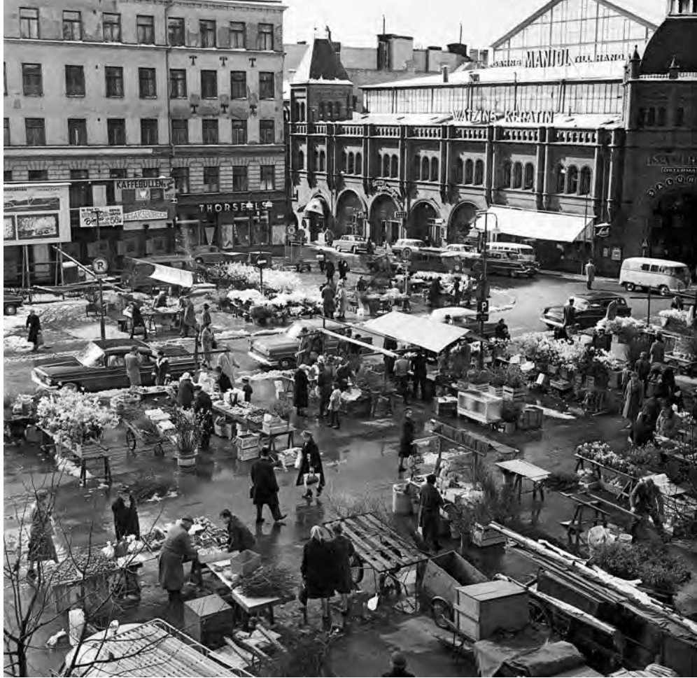
Östermalmstorg omkring 1960–1967, med kommers. I fonden Östermalmshallen.

Nedan vänster: Äldre varuskylt från hallen, Clas Johansons vilthandel med nummer 71–72. När hallen öppnade fanns inte mindre än 147 olika varustånd. Här fanns stånd med frukt, grönsaker, blommor, kött och levande fisk i sumpar. Årshyran i hallen låg mellan 300 och 350 kronor.