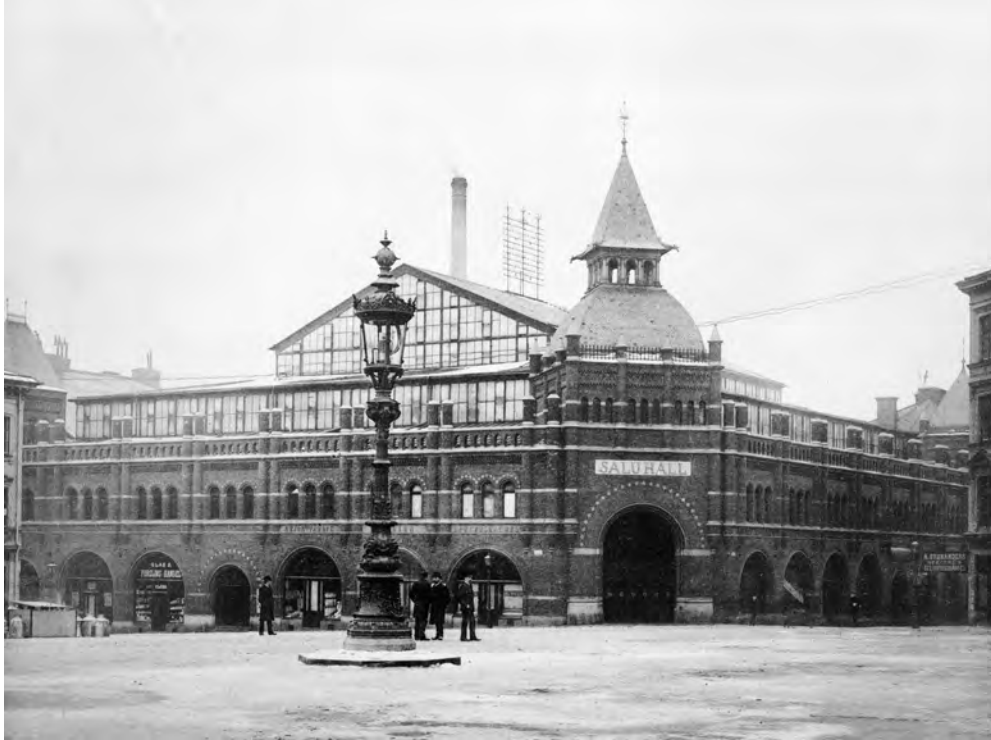
Den nyuppförda saluhallen i hörnan Nybrogatan och Humlegårdsgatan, år 1889. Foto: SSM.

Nedan: Bakom huset syns den lummiga trädgården med fruktträd, odlingar och drivbänkar. Bilden är från 1850-talet och visar kvar- teret Riddaren. På platsen kom sedan Östermalms saluhall att byggas. Foto: SSM.