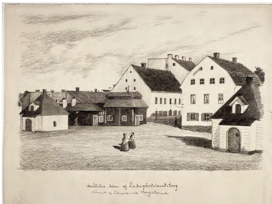
Äldre teckning från Ladugårdslandstorg som visar hörnet av Sibyllegatan och Storgatan. De två mindre husen till vänster och höger är så kallade spruthus, i dessa förvarades brandredskap.

I början av 1800-talet låg ett sockerbruk i den södra delen av torget i kvarteret Järnlodet. År 1854 öppnade Ladugårdslandets teater. År 1882 höll Frälsningsarmén sitt första möte i Sverige på teatern. Den gamla teatern ersattes med nya Folkteatern år 1906. På Folkkan spelades under åren 1955 till