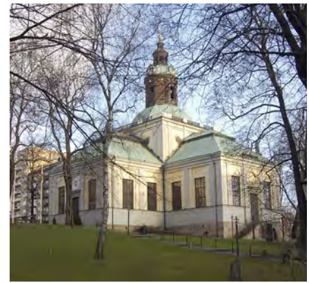
Kungsholms kyrka grundlagd år 1673, är en ypperlig representant för stormaktstidens byggnad. Ambitionerna var stora men ekonomin medförde att bygget avbröts. Först i början av 1800-talet restes kupolen till detta barockarkitekter M. Sphillers främsta verk.

stimulera denna utveckling donerade kungamakten tomtmark, särskilt på Gråmunkeholmen som därefter kallades Riddarholmen. De nya kyrkor som byggdes var centralkyrkor efter italiensk-nederländska förebilder som Katarina kyrka, Amiralitetskyrkan, (i dag Hedvig Eleonora) och Kungsholms kyrka. Men församlingarna hade dålig ekonomi och de sistnämnda kyrkorna fullbordades först långt senare. Sedan seklets mitt var tanken att grundligt modernisera slottet Tre Kronor, men krigen kom emellan. Slottets romerskinfluerade nordlänga stod dock färdig innan den stora slottsbranden år 1697.