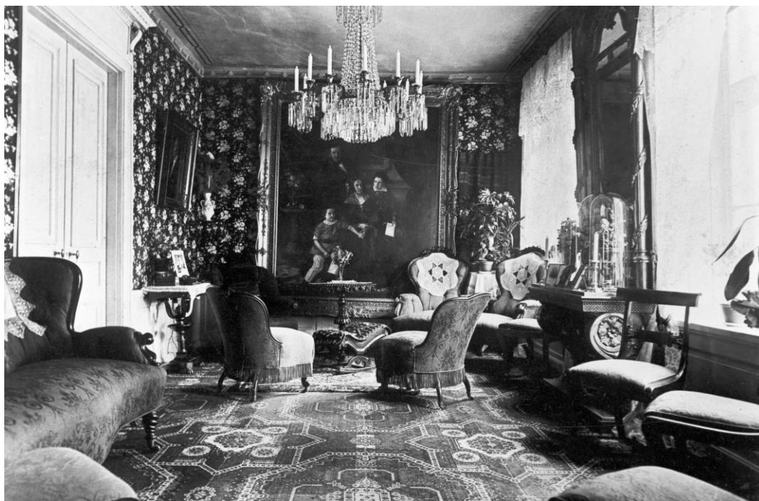
Kvarteret Guldfjärden mindre, fotograf okänd. Stadsmuseet i Stockholm bildnummer F44917.

Detta rum [fruns sängkammare] var familjens samlingsrum och dagligrum. Till måltiderna vandrade hela familjen från sängkammaren genom förmak, salong och in till matsalen. Efter måltiden företog sällskapet samma promenad tillbaka och betjänten kom varje dag med kaffebrickan in hit./Före måltiden anmälde han att bordet var serverat/ Sedan blev vi mestadels sittande i detta rum ett bra tag efter middagen.