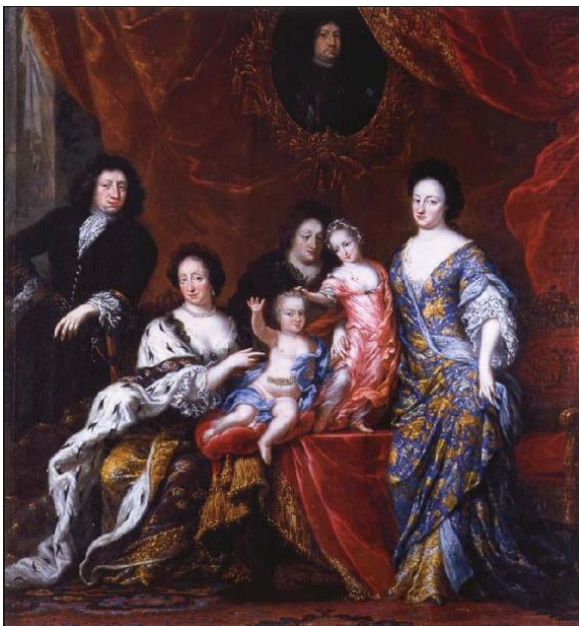
Karl XI, 1655-1697, kung av Sverige med familj, konstnär David Klöcker Ehrenstrahl. Nationalmuseum.