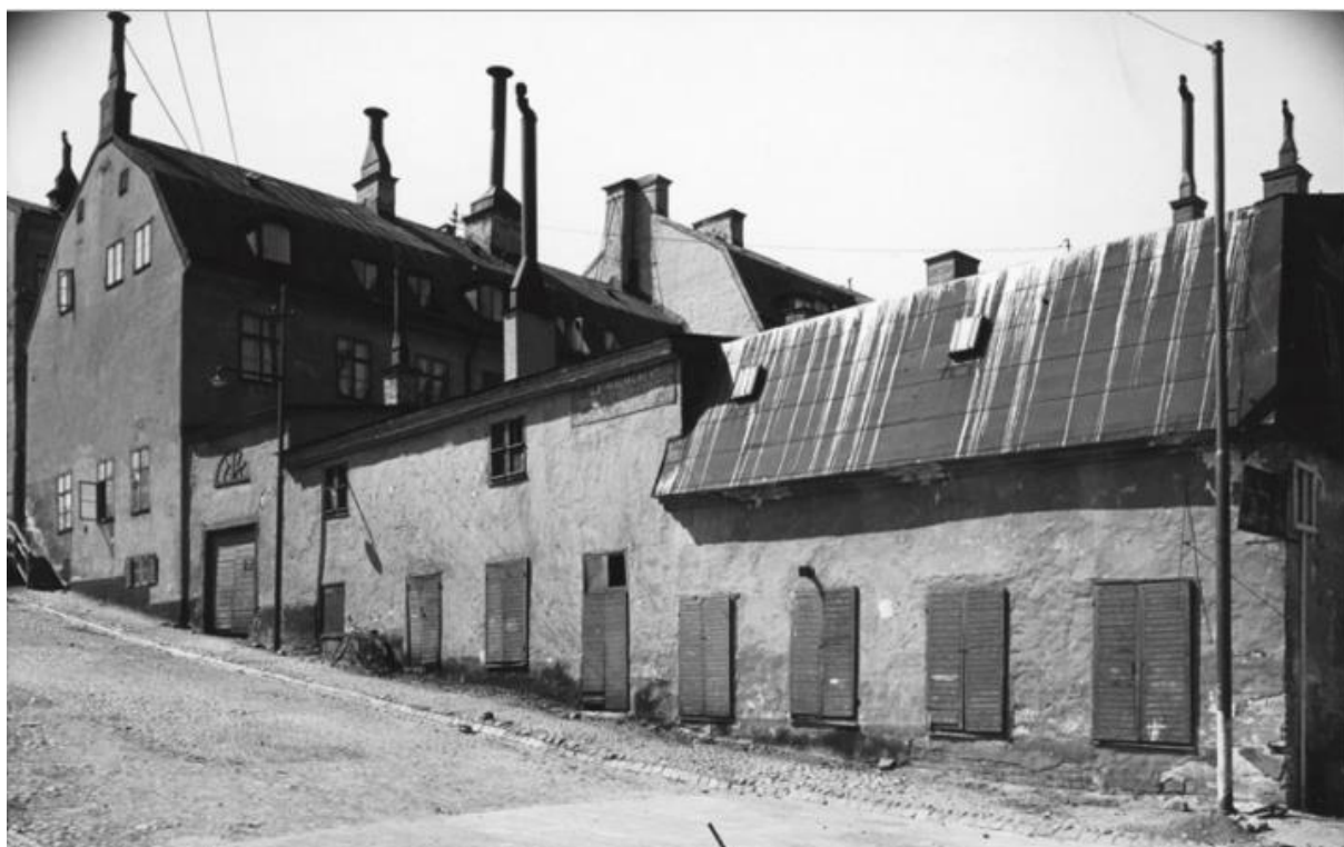
Guldgränd söderut mot kvarteret Guldfjärden Mindre från Söder Mälarstrand.

Vi kan göra oss en relativt god bild av hur färgeriet såg ut, eftersom det finns ritningar bevarade och flera fotografier som togs innan det revs i början av 1950-talet. En bygglovsritning av färgeriet i Stadsarkivet är särskilt intressant eftersom den visar hur längan var uppdelad i olika rum. Närmast bostadshuset låg Blåhuset med fyra stora kypar (färgbud), som gick att hålla varma för färgning av blått, svart och grönt kläde. I rummet intill, som på ritningen kallas Färgeriet stod i mitten en eldstad, den så kallade Fyren. Runt denna fanns åtta färgkar i olika storlekar för olika färger. Färgeriet fortsatte neråt sjön med ytre Ferghuset som var byggt på pålar. Där kunde klädet sköljas och tvättas. 11