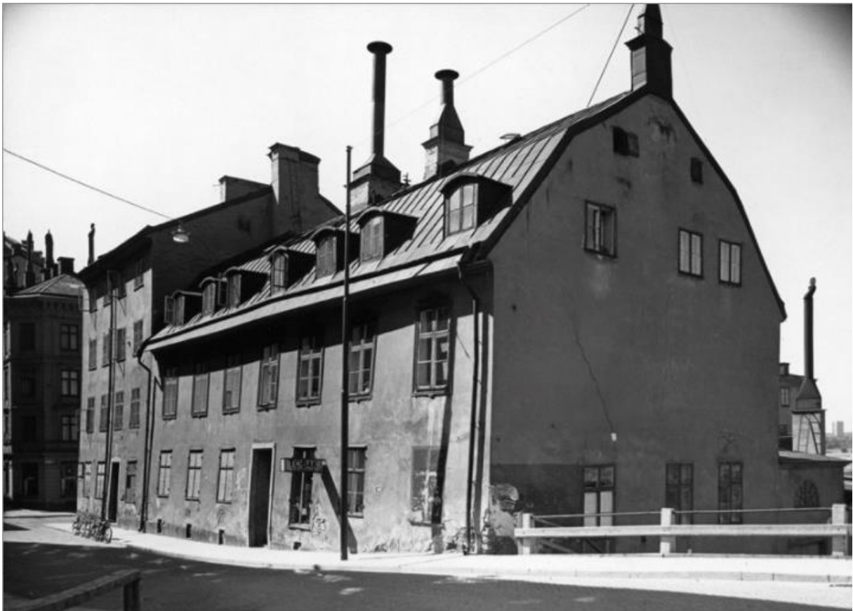
Kvarteret Goldfjärden Mindre från öster mot Brännkyrkagatan 6-8 och hörnet mot Guldgränd.