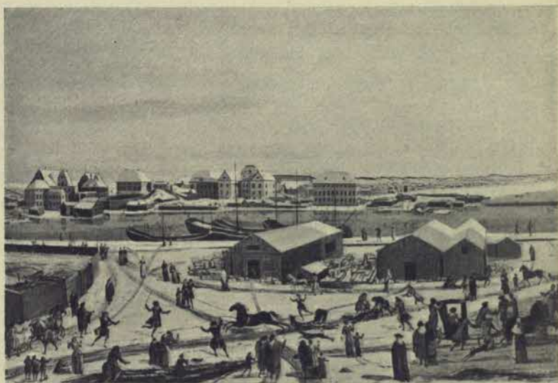
Blasieholmen från Slottsbacken. Efter oljemålning i Stockholms rådhus.

Staffan Sasses gränd och var belägen vid Bollhusgränden. Nog af, namnet Blasieholmen har bibehållit sig, och det under drottning Kristinas tid ännu någon gång använda namnet »Gambla Skipsholmen» försvann. 1