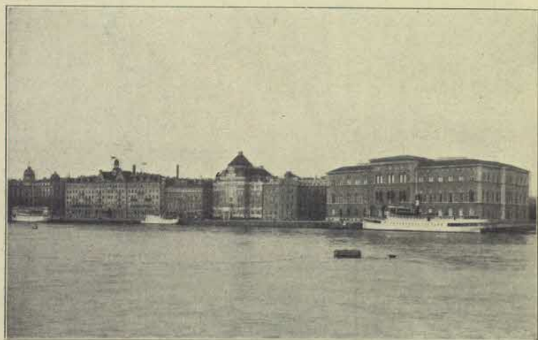
Blasieholmen sedd från söder 1914.