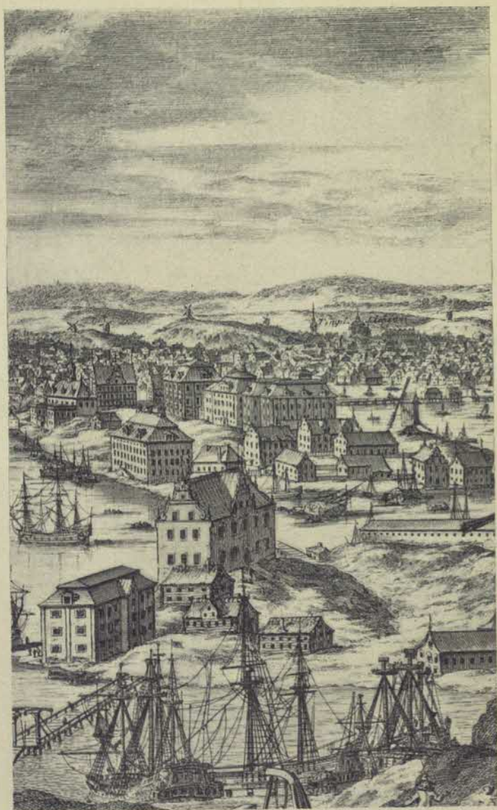
Blasteholmen från Skeppsholmen vid slutet af 1600-talet. Efter Dahlbergs Svecia ant. et hod.