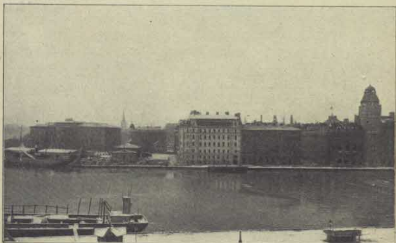
Blasieholmen sedd från norr 1914.