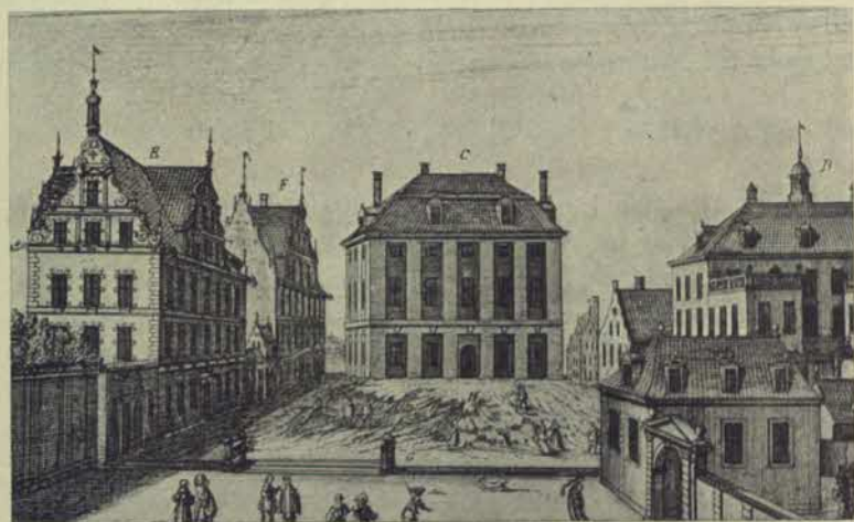
Tungelska (E), Wijnbladhska (F), Douglasska (C) och Wachtmeisterska (B) husen. Slutet af 1600-talet. Ur Dahlbergs Suecia ant. et hod.