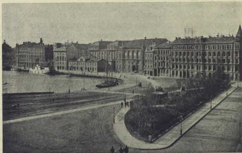
Norra Blasieholmshamnen från Birgerjarlsgatan 1894. Efter fotografi.

taren Lind (af Hageby) sålde den år 1821 \frac{25}{2} till garfvaren Jakob Westin d. ä. Efter dennes död, 1829, erhöll mågen, lifmedikus Magnus Retzius, en tredjedel såsom arf vid arfskiftet 1833 och tillköpte 1841 \frac{4}{12} de tvenne öfriga tredjedelarna. Han blef således ägare af det hela, som han innehade till 1856 \frac{26}{4} , då ägare genom köp blefvo d. v. ryttmästaren sedermera krigsmi-